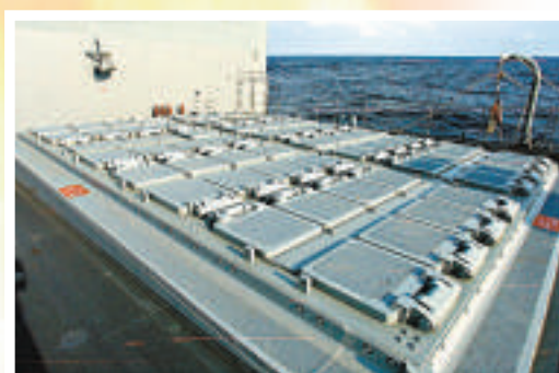
▲052D型導彈驅逐艦裝備兩套32單元的垂直發射系統