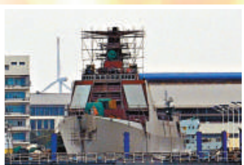
▲正在船塢建造的中國海軍052D型導彈驅逐艦配備有源相控陣雷達

西方媒體認為，052D還有望肩負起對陸攻擊的重任。美國媒體指出，中國新研製的「東海10」型巡航導彈有效射程在1500至2500公里之間，殺傷力超過美國的「戰斧」式巡航導彈。