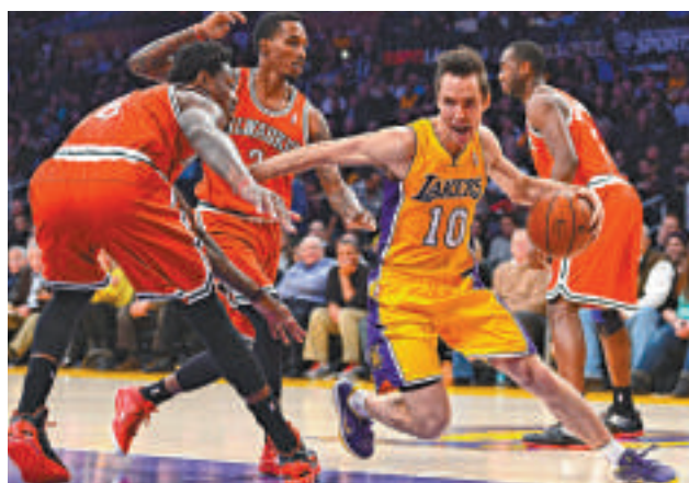
◀拿殊(右二)年屆三十八，要他繼續打攻是強人所難

一季經歷數種不同的戰術，無疑讓湖人的球員無所適從，陣中主將高比拜仁一度嘗試改變自己「獨食」的打法，更多地傳球，尤其分球予內線霸王侯活，但兩人欠缺默契反而讓球隊出現更多失誤，高比突然的改變亦讓侯活經常不知道隊友究竟是傳球抑或投球，朝令夕改的戰術令湖人依舊在原地踏步，於NBA這個殘酷的聯盟，當雷霆、快艇等年輕隊伍飛快進步、馬刺這種老牌球隊亦不斷鞏固自己的實力，湖人已如川流中不進則退的小船，再不加快腳步作出針對性的改變，躋身季後賽這個目標只會離他們越來越遠。