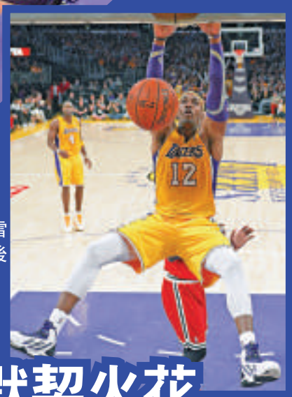
▶侯活的加盟雷聲大，但加盟後的表現卻兩點小