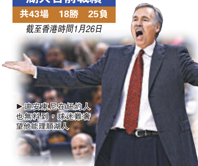
▶迪安東尼在紐約人也無料到，球迷難奢望他能理順湖人