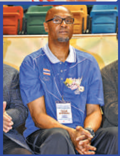
▲祖拜仁坦言湖人難望晉級季後賽

至於祖拜仁最希望能奪冠的球隊？「絕對是湖人無疑！」有什麼能比自己兒子奪冠更讓祖拜仁高興？一句話，父愛橫溢。