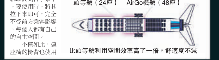
比頭等艙利用空間效率高了一倍，舒適度不減