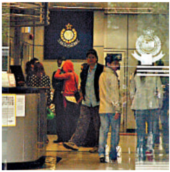
▲兩少女（黑白點及紅衣者）被帶返警署協助調查

前副廉政專員、執行處首長李銘濤早在2011年12月已達退休年齡，但基於工作需要，一再延任至去年7月31日。但李在去年6月18日突然申請縮短合約，白韞六在委員會上表示，當時曾考慮過當時責任執行處處長1年的李寶蘭，但認為她未適合承擔首長職務。因此，他在去年7月初上任專員，即向行政長官建