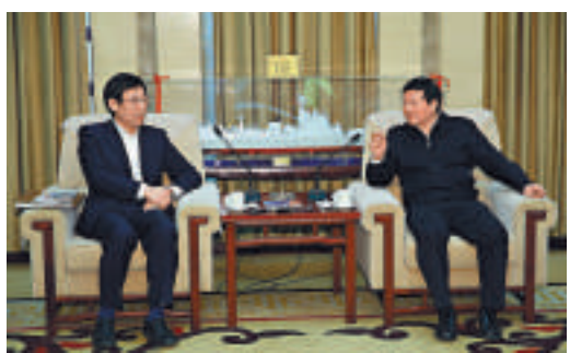
▲陝西省委副書記、省長婁勤儉（右）與大公報董事長兼社長姜在忠（左）交談

陝西省政府秘書長陳國強、省委宣傳部常務副部長任賢良、省政府辦公廳巡視員王紅章，《大公報》陝西辦事處主任張建麗等參加了會見。