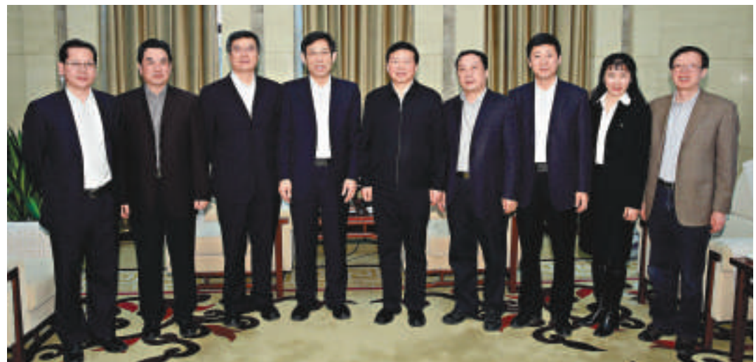
▲陝西省委副書記、省長婁勤儉（右五），陝西省政府秘書長陳國強（右三），陝西省委宣傳部常務副部長任賢良（右四），陝西省政府辦公廳巡視員王紅章（右一），會見大公報董事長兼社長姜在忠（左四）、總編輯賈西平（左三）、總經理盛一平（左二）、大公網總裁林學飛（左一）、陝西辦事處主任張建麗（右二）一行