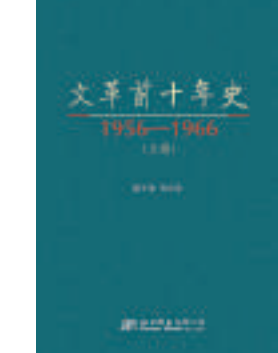
▲蕭冬連《文革前十年史》

濟的繁榮，未能避免政治的動盪，更沒能阻擋「文化大革命」的發生。這是一段包含着多少榮辱沉浮的歷史，劉少奇被指定爲接班人又被認爲中國的赫魯曉夫，周恩來險些失去了總理的職位，彭德懷受到不公正的批判，陳雲三次受命又三次受貶，還有張聞天、黃克誠、譚政、周小舟、鄧子恢、王稼祥、習仲勳、李維漢、羅瑞卿、彭真、陸定一、楊尚昆……還有那些右派、那些「右傾機會主義分子」、「修正主義分子」……然而，這不只是一個人的命運史，這是一個民族的命運史，是一段中國的社會主義走向的探索史。作者說，重溫這段歷史，並非勾起人們美好或苦澀的回憶，更不是滿足人們對奇聞軼事的好奇心，而是希望能從中吸收歷史的智慧，以更堅定的步伐走向未來。