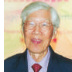
▲譚志成乃香港藝術館首位總館長

譚志成的其他著作有：《新水墨畫運動的搖籃》、《中國新水墨藝術重鎮：香港》、《二十世紀香港國畫發展的背景》、《清初六家與吳歷》、《格羅夫藝術百科全書內之元龜編》等。