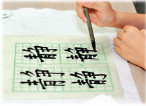
◀學生書寫楷書「靜」字

「書由心生」，六場「蔣院士·臨靜字」書法工作坊，讓學生們臨摹了潘雲鶴院士楷書、何繼賢院士篆書和謝和平院士草書的「靜」字，院士們手把手地書法傳授，達到了典範轉移的效果。選擇靜字是因為「在當下城市這樣一個繁忙浮躁的環境裡，『靜』字所詮釋的，是我們逐漸失去的一份文化心態。」另外，從外形看，「靜」字有書法的形態美，又蘊含字義的內涵。左右結構搭配勻稱，外形內斂不張狂，重心在黃金分割點上。「靜」字有多層意思，其一，安定曰靜。《莊子·天下》一文說：「在己無居，形物自著，其動若水，其靜若鏡。」其次，緘默曰靜，如諸葛亮《戒子書》裡說：「靜以修身，儉以養德。」此外，道家閉關端坐，無思無慮也為靜。《雲笈七籤》有云：「修煉之士，當須