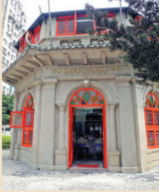
曾為昔日南灣花園餐廳和桌球室的八角亭現為圖書館

八角亭圖書館設計雖小，卻是現今極少數仍使用杜氏圖書分類法的華人圖書館之一，其藏書達2萬冊，另有1.5萬冊存放在澳門中華總商會的書庫，其收藏報刊達90多種，其中以中文報刊為主。館藏計有早期的《華僑報》、《澳門日報》、《文匯報》、《大公報》、《光明日報》的報紙合訂本，對於查找50-70年代的資料非常有幫助。開放時間為上午9時至12時，晚上7時至10時（逢星期一及公眾假期休館）。