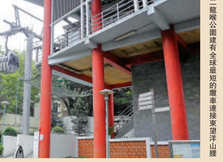
二龍喉公園建有全球最短的纜車連接東望洋山麓