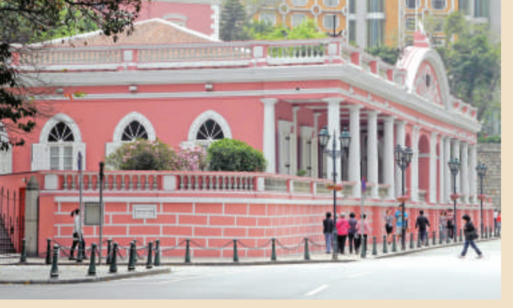
陸軍俱樂部被譽為在東方的歐洲典型建築物典範之一

俱樂部創建於1870年，為一私人會所，招待軍官或被應邀的平民進行文娛活動。建築物本身獨具優雅氣度，更被譽為在東方的歐洲典型建築物典範之一。1994年，俱樂部進行翻新，保留所有外部結構，而內部裝修則經過精心設計以反映當其時的氣氛及格調。榮獲美食大獎的俱樂部餐廳現已對公眾開放，提供精緻的葡國菜，它環境優美，格調高雅，裝潢體現了中西合璧的設計藝術。在這經過歷史洗禮建築物的優美環境下，感受真正由葡國廚師炮製的美食，享受絕佳美味，感受中西文化交流。開放時間為星期一至日中午12時至下午3時，下午6時至晚上10時。