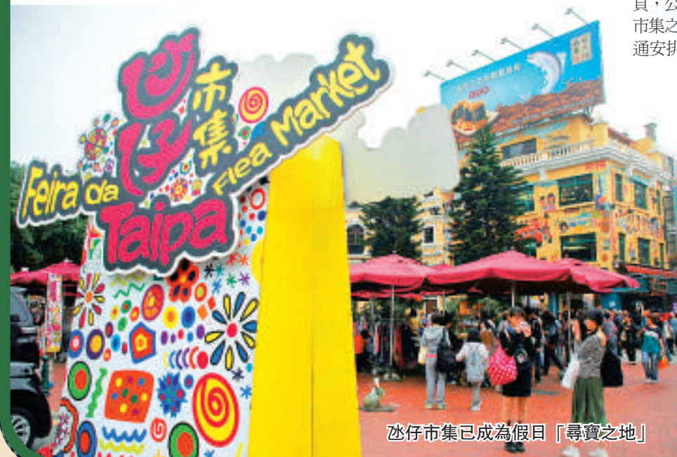
氹仔市集已成為假日「尋寶之地」

氹仔舊城區（消防局前地）的氹仔市集，逢周日及加開市集日上午十一時至晚上八時營業，共設有30個實業特式貨品攤位。氹仔市集一直以來是本澳旅遊熱點，亦是居民的休閒好去處，不少市民及遊客在市集日都會到場遊逛及購物，搜尋心儀物品，成為居民