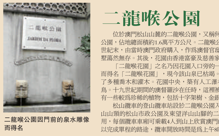
二龍喉公園因門前的泉水雕像而得名