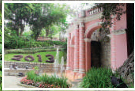
園內有一座噴水池充滿南歐風味