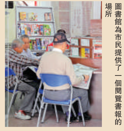
圖書館為市民提供了一個閱覽書籍的場所