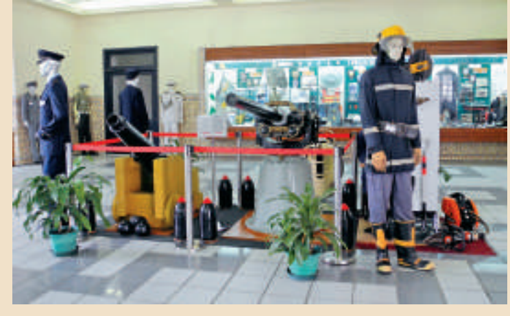
設於大樓內的保安部隊博物館

查詢：澳門基金會教科文中心 電話：(853) 2872 7066 電郵：unesco_info@fin.org.mo