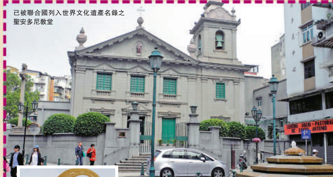
已被聯合國列入世界文化遺產名錄之聖安多尼教堂