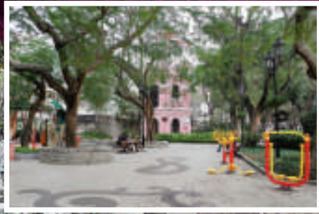
加思欄花園環境清幽，是市民和旅客熱門之地。