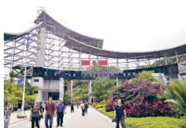
▲目前西雙版納已有6條經邊境旅遊線路獲批，圖為連接西雙版納與緬甸的磨憨口岸。

【本報記者康靜明二十八日電】記者從雲南省公安出入境管理工作會議獲悉，雲南省西雙版納、文山、紅河、保山、德宏5州市的10餘條邊境旅遊線路，年內有望獲得異地辦理入境證件的政策。屆時，各地遊客只要持身份證就可西雙版納就地辦理出境證件，進入緬甸、老撾旅遊。