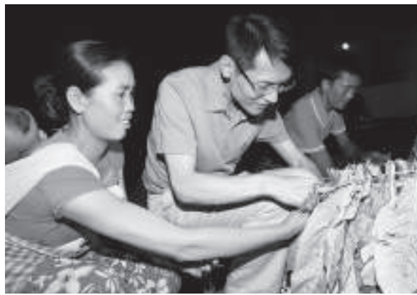
▲德宏州委書記李磊與傣族群眾一起穿煙葉

與此同時，包括國家和省級的民族專項資金、興邊富民資金、對口幫扶資金、扶持民族地區企業發展資金及其他各類公益資金等亦紛紛投向其他各少數民族地區，為其發展注入了外來動力。據了解，僅2012年，國家和雲南省共下達德宏州各類民族專項資金8828萬元，籌建了470個項目，有力推動了各民族衛生、教育、體育、科技等社會事業的發展。另外，多年來，在興邊富民特色優勢產業試點的幫助下，德宏數十萬少數民族農戶接受了核桃、油茶、黑木耳、獼猴桃、堅果、橡膠、茶葉等的種植技術培訓，大為提高了種植收入，許多村寨的基礎設施建設也實現了改頭換面般的飛躍，以至於有人感慨地說：「現在這種面貌，如果只靠我們自己，恐怕再等10年都不行。」