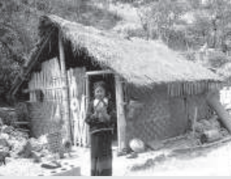
▲德昂族茅草房變磚瓦小樓

據統計，在多年的扶持發展下，截至2010年，德宏州55個德昂族自然村的人均純收入已增長到2259元，上海的幫助居功至偉！現在，走進德昂族村寨，許多群眾提到上海都會發自內心地說：「謝謝他們！」