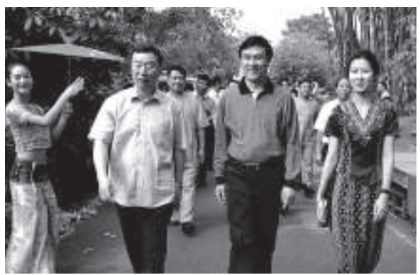
▲2012年4月，時任國家民委主任楊晶（前中）、時任雲南省政府副省長劉平（前左一）到德宏調研民族工作

記者在社區發現，很多街道都有與民族團結、民族文化內容有關的宣傳欄。陳德倡說，宣傳好民族政策是