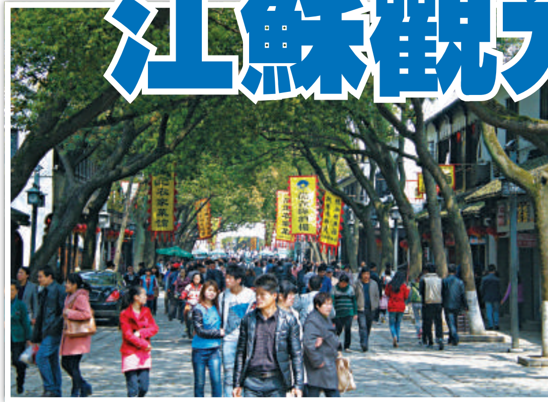
▲清明節小長假第一天，蘇州同里古鎮景區遊客爆滿

4月4日是清明節三天長假的第1天，儘管今年內地出現H7N9禽流感疫情，但並未影響內地民眾的出遊興致。在已確診四個病例的「重災區」江蘇省，各地景點依舊遊人如織，部分景區的外地遊客數量甚至多於往年。另一方面，今年清明節假期高速公路免費開放，4日江蘇各主要高速公路車流量均大幅增加，南京長江大橋、二橋等主要過江通道更是出現嚴重擁堵。各高速入口的電子顯示牌上，不時提醒出行遊客選擇車流量較少的通道通行。 【本報記者強薇、劉亞斌、賀鵬飛江蘇四日電】