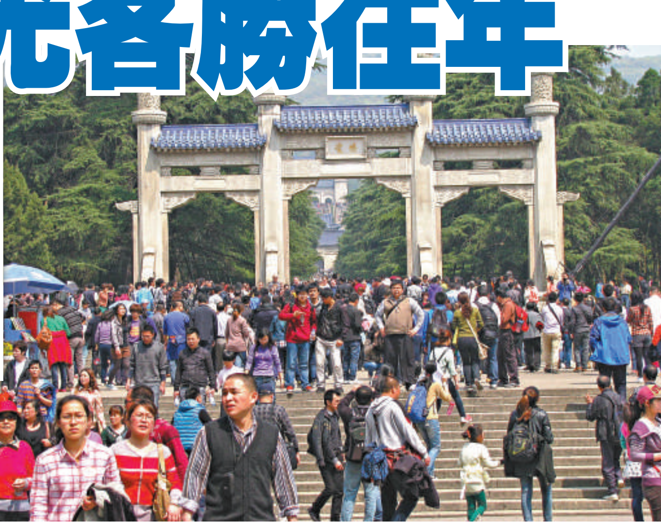
▲南京中山陵園景區4日遊人如織

4月4日是清明節三天長假的第1天，儘管今年內地出現H7N9禽流感疫情，但並未影響內地民眾的出遊興致。在已確診四個病例的「重災區」江蘇省，各地景點依舊遊人如織，部分景區的外地遊客數量甚至多於往年。另一方面，今年清明節假期高速公路免費開放，4日江蘇各主要高速公路車流量均大幅增加，南京長江大橋、二橋等主要過江通道更是出現嚴重擁堵。各高速入口的電子顯示牌上，不時提醒出行遊客選擇車流量較少的通道通行。 【本報記者強薇、劉亞斌、賀鵬飛江蘇四日電】