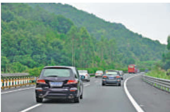
▲相比3日晚12條高速公路路段現「車龍」，廣東4日高速公路擁堵情況緩解。圖為往粵西的高速路段車流比較暢順 本報記者方俊明攝

廣東交警部門負責人表示，清明節期間，廣東各線高速公路服務區將迎來客流高峰，預計4月5日至7日部分服務區或「爆棚」，如京港澳高速沿線的瓦窩崗服務區、廣湛線的梁金山服務區、深汕高速的鮑門服務區等料成為車流「重災區」。目前各服務區都推出提供免費應急藥品、茶水、免費發放地圖、諮詢、手機充電等服