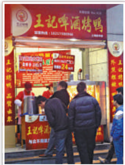
▲上海閔行一家烤鴨店以促銷獲客

相對於牛肉的漲價，旁邊的豬肉櫃檯顯得冷冷清清。兩個售貨員無所事事地開始聊天。更為冷清的是出售烤鴨和烤雞的熱食櫃檯，甚至連營業員也不見了。一些出售冷凍雞鴨的櫃檯，還打出了促銷的牌子。記者看到，雞塊的價格一斤不到7元，比往常要便宜很多。