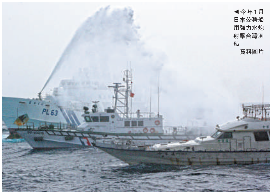
◀今年1月日本公務船用強力水炮射擊台灣漁船 資料圖片

台日漁業會談於2009年2月以後中斷談判，去年11月30日為了重啟談判，在東京舉行第17次台日漁業會談首次預備性會議，未能達成共識；第2次預備性會議在今年3月13日召開，雙方對漁船作業水域及漁業資源養護等議題充分交換了意見。