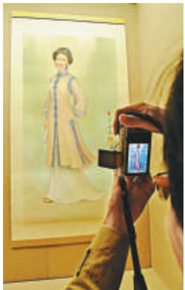
梁潔華畫作吸引觀眾駐足 本報攝

【本報訊】記者任麗西安報道：香港著名畫家梁潔華「絕代風華——古代女性人物畫展」即日起至本月二十五日在陝西省歷史博物館東展廳專場展出。七十四幅作品中，藝術佳作《芮姜畫》與陝西省考古研究院合作，將韓城梁代村兩周遺址的相關考證成果展現在世面面前，結合考古研究與藝術作品。