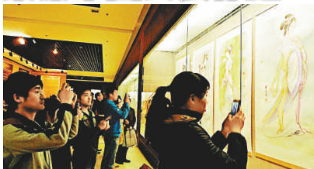
觀眾觀看梁潔華畫作

梁潔華是香港知名的愛國企業家、社會活動家、慈善家和畫家，其父梁錫珪為港著名的老一代商業鉅子、銀行家和慈善家。一九九四