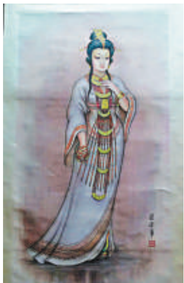
梁潔華作品《芮姜畫》