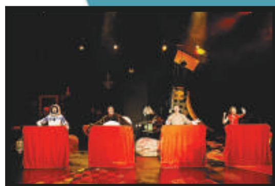
資料館職員以新版《遍地芳菲》迎接新總監