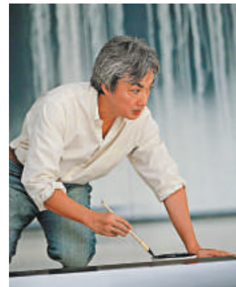
▲千住博為作品塑造出流動的效果