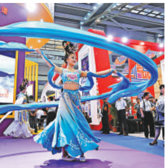
▲一位陝西演員在文博會上表演舞蹈

商務部國際貿易談判代表兼副部長鍾山、財政部部長助理余蔚平分別就文化貿易的政策支持、中央財政對文化貿易的支持等情況作了介紹。深圳市長許勤表示，近幾年來，深圳在政策創新、載體創新，科技創新和產品創新等五個方面取得了較好成效，未來將重點瞄準文化貿易的新技術，新業態和新市場，進一步做大做強文化貿易體系，增強文博會等平台的國際影響力，進一步完善文化貿易的政策體系，服務體系、創新體系和網絡體系，讓更多優秀文化產品和服務走向世界。