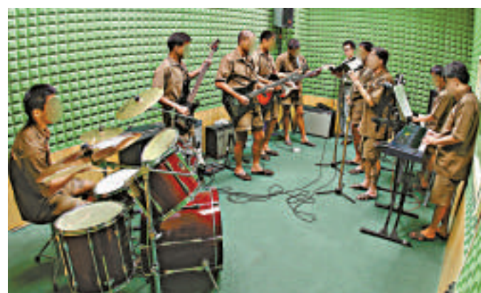
▲赤柱監獄設有band房，當中有由在囚人士組成的「confession」樂隊，讓在囚人士以音樂陶冶性情