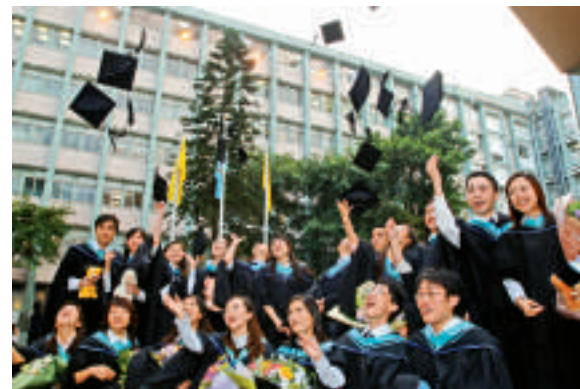
▲本港大專生負債問題嚴重