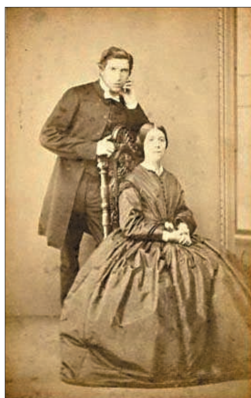
老俾士與溫樂鍾夫婦