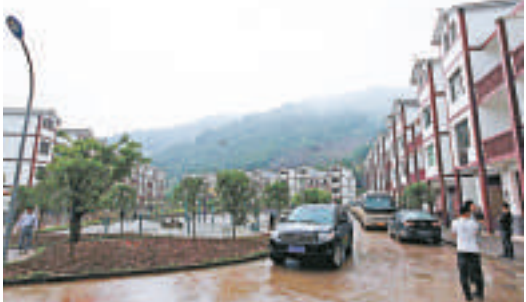
▲港澳傳媒到訪高山移民的齊聖村