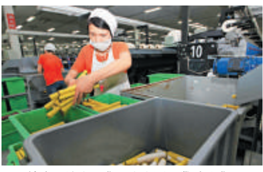
▲三峽庫區培育工業「生力軍」帶動就業

他指出，重慶加工貿易還是方興未艾，服務貿易潛力很大，目前佔比不到10%。今年1-4月份有好的勢頭，預計上半年服務貿易會加快發展。此外重慶是中央設置的五個跨境電子商務試點城市之一。中央給予重慶四項政策：一般產品進口、一般產品出口，保稅產品的進口、保稅產品的出口。他表示這些政策要與渝新歐國際鐵路通道、進口保稅商品的展示銷售融合發展。