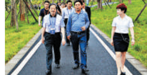
▲港澳傳媒實地了解三峽庫區新城建設