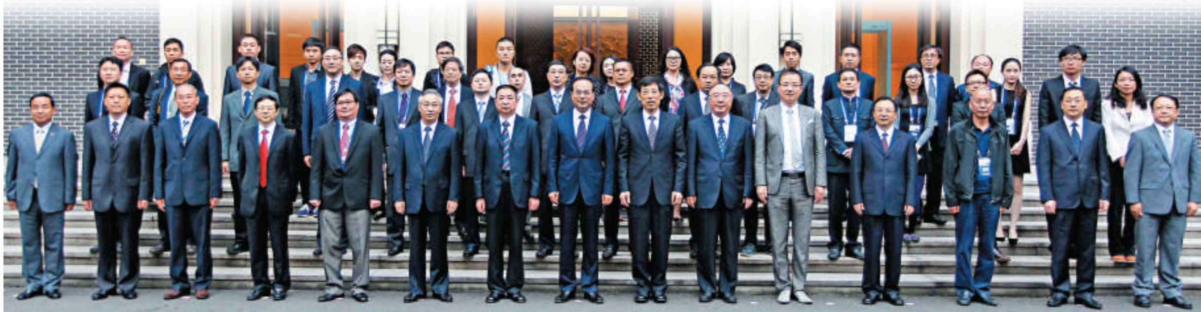
▲中央政治局委員、重慶市委書記孫政才（前排左八），重慶市長黃奇帆（前排左十），重慶市委副書記張國清（前排左六）與港澳傳媒高層參訪團一行合影留念