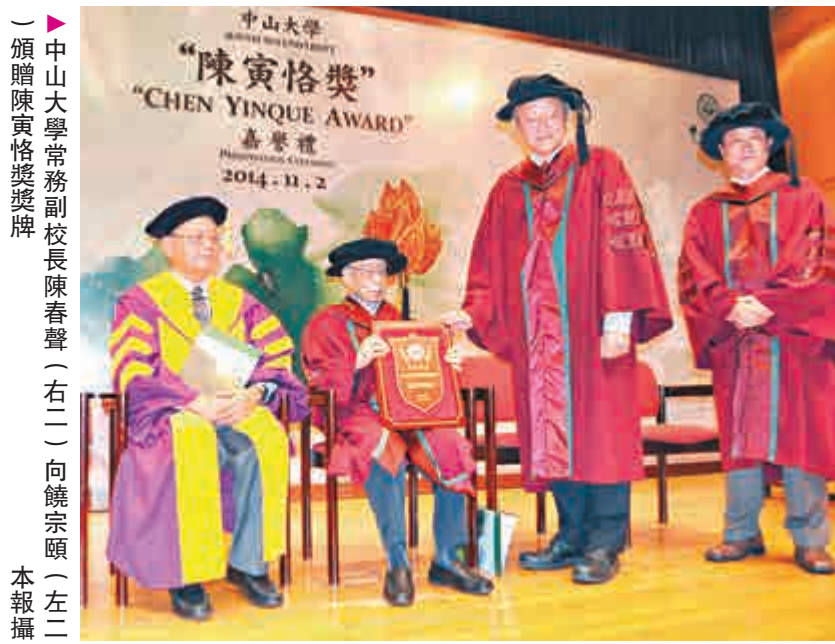
中山大學常務副校長陳春聲（右二）向饒宗頤（左二）頒贈陳寅恪獎獎牌