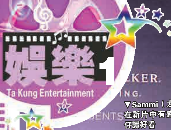
▼Sammi (左)與鎮宇 在新片中有感情戲，安 仔讚好看