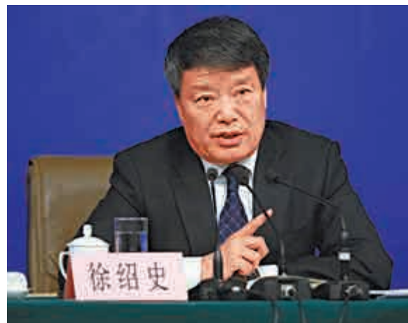
▲5日，全國人大三次會議新聞發布會上，國家發改委主任徐紹史答中外記者問