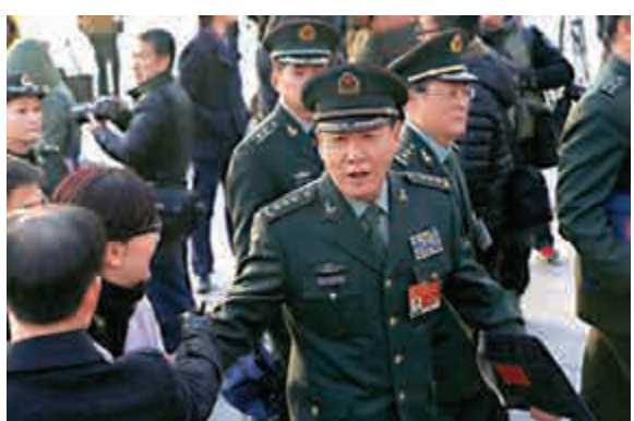
▲5日，總後勤部政委劉源上將在人民大會堂外被記者提問 中新社