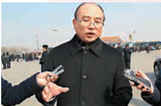
▲深圳市長許勤稱「一簽多行」調整應有利深港合作交流

全國兩會上熱議的赴港「一簽多行」政策一旦收緊，其影響將覆蓋逾150萬深圳戶籍居民。5日，深圳市長許勤在北京被問及如何看待「一簽多行」調整時表示，「一簽多行」政策的合理調整，要在「有利於深港兩地人員往來和合作交流」的原則上進行探討。他還透露，深圳將推出更多類似前海青年夢工廠的項目，專門為香港青年提供更好的創新創業空間。 【大公報記者唐剛強北京五日電】