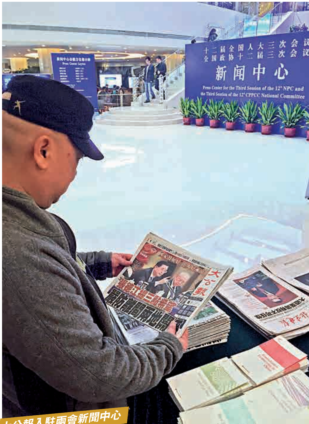
大公報入駐兩會新聞中心