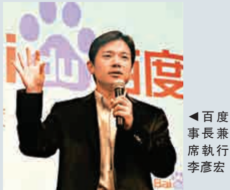
百度董事兼首席執行官李彥宏