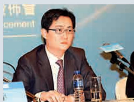
騰訊主席兼首席執行官馬化騰指出，中央應加快制定「互聯網+」全面發展的國家戰略