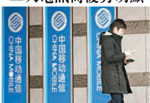
▲券商估計中移動第四季盈利有258.06億至294.87億元人民幣

互聯網產業在經濟新常态下，成為中央力捧的新興產業。國務院總理李強提出，將全面推進「三網」融合，提升寬頻網絡速率；此舉不但有利剛提供4G服務的三大電訊商，同時相關電訊設備股亦能受惠。