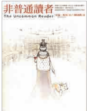
▲繁體版《非普通讀者》二〇〇九年由台灣漫遊者文化出版

艾倫·貝內特於一九三四年出生，來自屠夫家庭的他，得益於英國戰後的福利社會制度，後進入牛津學習，並成為英國當代最重要的劇作家之一，兼具小說家、演員多重身份。 貝內特曾兩度拒絕英國女王授勳。上世紀六十年代以電視系列片《藝術之外》成名，主要劇作包括《往事四十年》、《喬治三世的瘋狂》等。從七十年代起開始投身劇本創作，並擔任導演及演員。他以《歷史男孩》贏得戲劇界最高榮譽東尼獎最佳劇本獎。《讀者文摘》將他選為二〇〇五年風雲作家。而他的作品自傳作品和小說《非普通讀者》也是廣受好評的文學暢銷書。 貝內特在《非普通讀者》中，以虛構故事的形式巧妙地演繹了一段女王與書之間的緣分故事，幽默中夾雜嘲諷，敘述迷離閱讀之後個人內在的轉變，以及自此與外在事物的矛盾。貝內特也經常表示：書卷可以把人們帶到本身以外，就算如英女王這樣貴族中的貴族，位於人類階級的上層，卻在年過半百的時候「沉溺」於相對枯燥的閱讀，把自己精彩的生活「宅」起來，雖然小說是虛構的，但也能證明書籍中蘊藏的智慧，以及人們能通過閱讀，不斷地豐富自己。 在現時的社會中，閱讀風氣也真的發生了變化，深度閱讀和精讀在減少，而娛樂閱讀和淺閱讀在增多。所以怎樣閱讀比較適合自己，或許該是我們應該思考的一個問題。