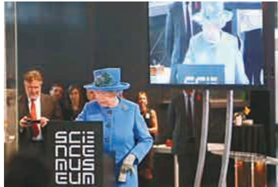
◀伊利沙伯女王是個與時俱進的人，去年十月，她在參觀倫敦科學博物館時發布了自己的首條推文