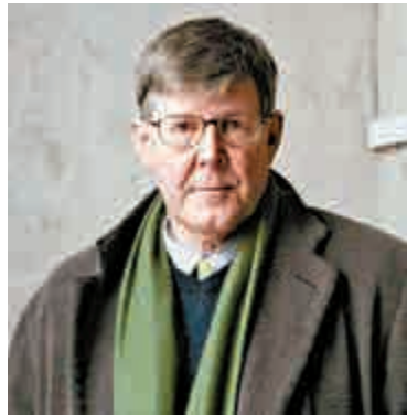
◀《非普通讀者》作者、英國著名劇作家艾倫·貝內特