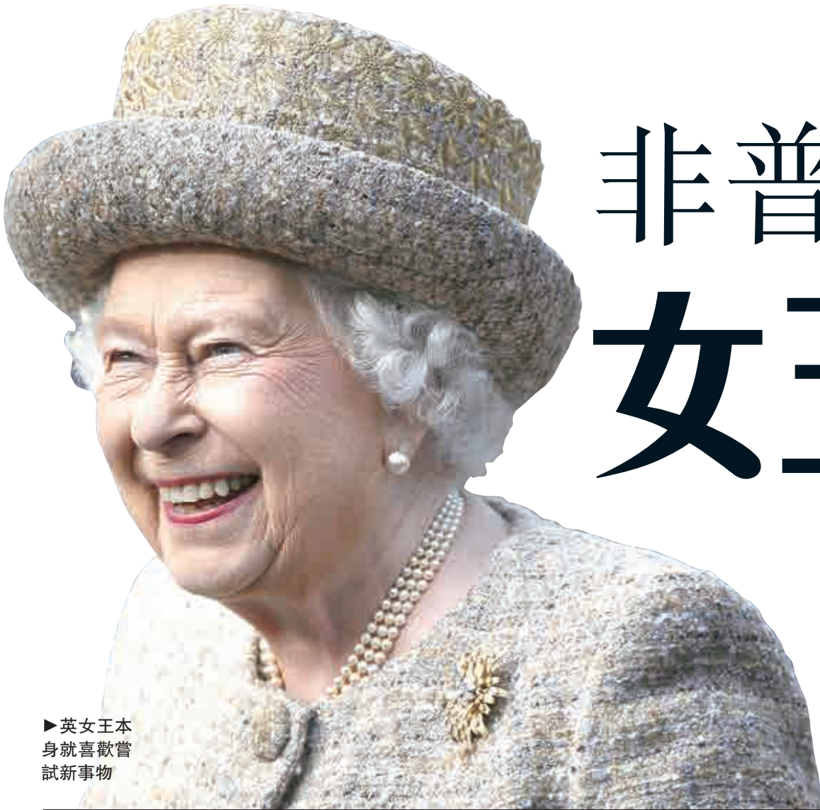
►英女王本身就喜歡嘗試新事物