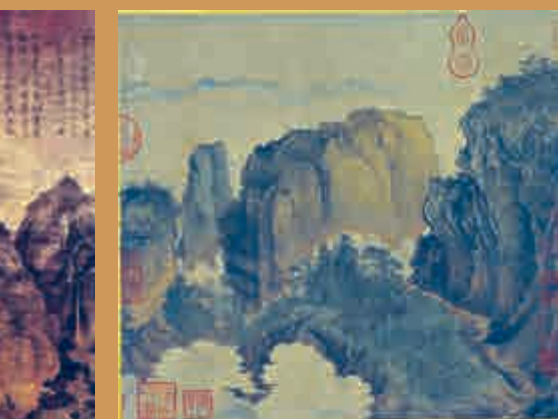
▲宋代蕭照繪《關山行旅圖》