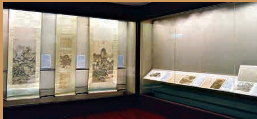
▲「典範與流傳」展覽現場