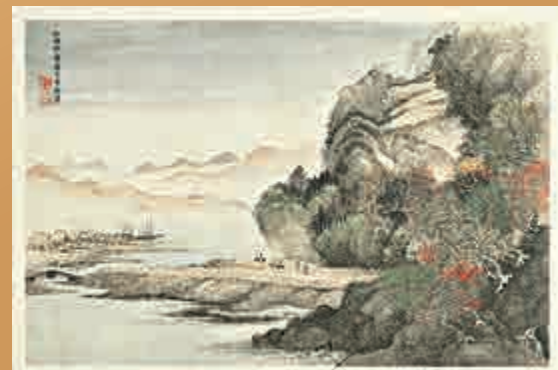
▲清代惲壽平、王翬合繪《花卉山水合冊》