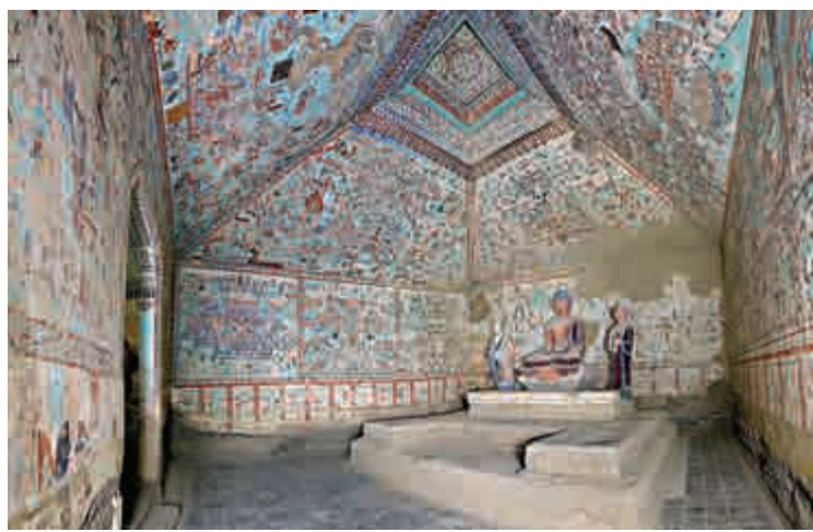
▲中國敦煌莫高窟第285窟內景，西魏（535-556）

其他展品包括蓋蒂研究所特藏的善本古籍和地圖。展覽的焦點之一，是世上最早有紀年的印刷品《金剛經》。此佛典乃從梵文原稿翻譯過來的中文版本，現為倫敦大英圖書館所藏，之前從