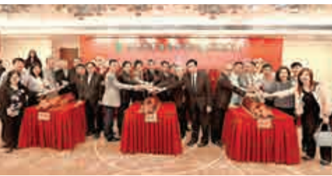
▲賓主切金豬儀式 ▲荃灣鄉事委員會第30屆執委，與主禮嘉賓合照