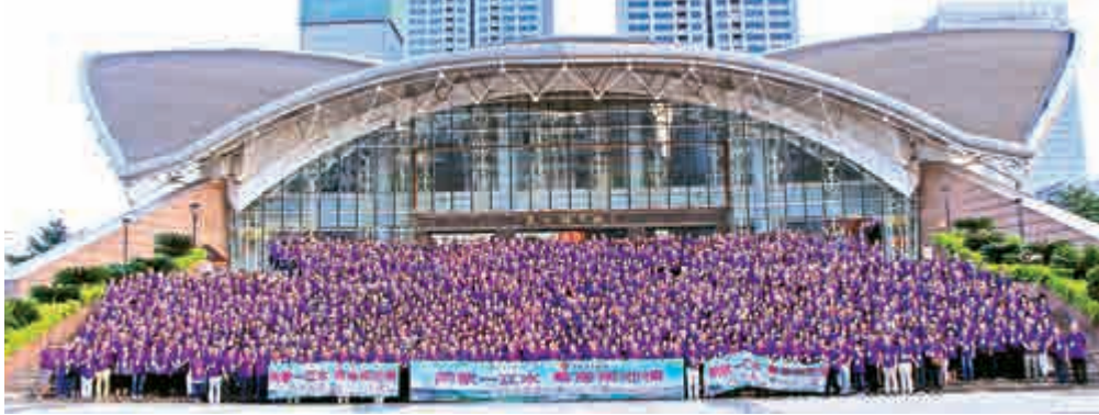
▲逾千義工在惠州市體育館合影

中聯辦副主任林武表示，港島繁榮穩定的一片天依靠各人雙手共同努力撐起，希望各團員繼續堅定不移地高舉愛國愛港旗幟，繼續攜手發展壯大愛國事業，為香港的繁榮穩定作出更大的貢獻。他讚揚去年大遊行、大簽名等「挺政改」各項活動都有港島各界義工的身影，並稱「一國兩制」18年來在港取得巨大成功，