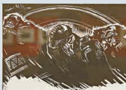
▲木版畫《自願者》