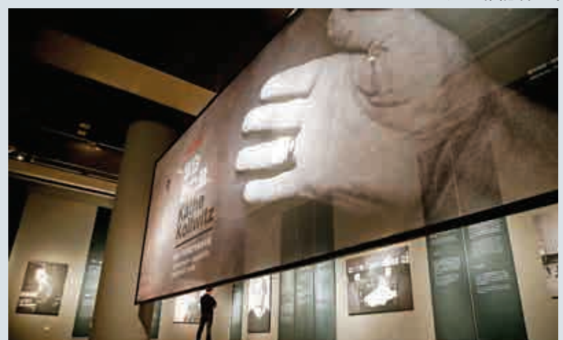
▲中國美術館「黑白的力量」展廳