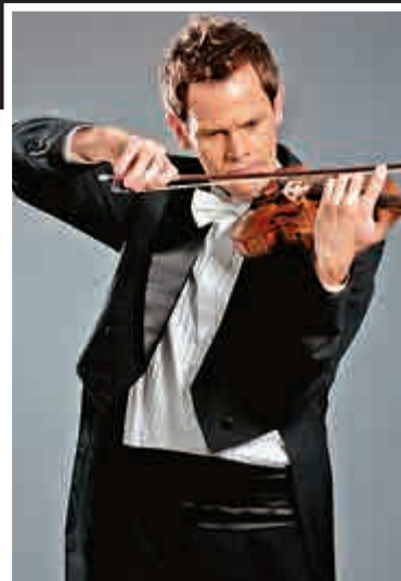
曲 遊刃有餘 ▶ 格德霍特演奏《第二小提琴協奏曲》

香港小交響樂團本樂季的其中一樁盛事，肯定是本週末當代著名作曲家彭德雷茨基來港首度率領樂團演奏自己所作的《第二小提琴協奏曲》「變形」。「小交」有幸邀得這位大師級作曲家親臨領導，確實與有榮焉。