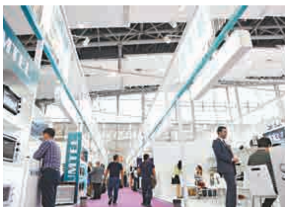
▲客商在廣交會土耳其企業展位參觀

118屆廣交會共有來自40個國家和地區的604家企業參展，其中「一帶一路」沿線有28個國家353家企業參展，佔比58.44%。廣東省副省長陳云賢稱，廣東是首個上報實施方案、完成與國家「一帶一路」規劃銜接並印發實施方案的省份，在推動與「一帶一路」沿線國家的