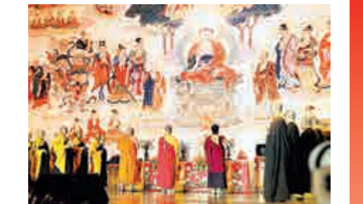
▲學誠大和尚、十一世班禪、祜巴龍莊猛為論壇祈福

汪泉說，在當前和今後一個時期，交流基地將以兩岸佛教文化交流為主要内容，建立健全工作機構和管理制度，搭建交流活動平台，舉辦兩岸交流活動，打造兩岸交流固定品牌，盡快形成較大影響力和