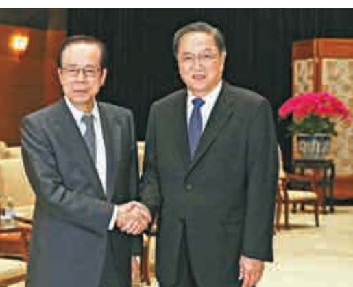
▲23日，俞正聲在北京會見福田康夫

另據《日本經濟新聞》報道稱，預定於11月1日在韓國首爾舉行的中日韓首腦會談，將就明年在日本舉行三國首腦會談達成一致。預計中國國務院總理李克強、韓國總統朴槿惠將前往日本參加會談。三方通過再度確認定期舉行因與日關係惡化而中斷約3年半的首腦會談及增加首腦互訪，來促進關係改善的進程。聯合文件中將寫入相關內容，加強環境、能源領域合作的内容也可望寫入。