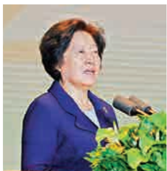
▲孫春蘭致辭時說，宗教的生命力在於與社會發展「同願同行」

中共中央政治局委員、中央統戰部部長孫春蘭，原全國人大常委會副委員長許嘉璐，國家宗教事務局長王作安，中國佛教協會會長學誠大和尚、中國佛教協會副會長、第十一世班禪額爾德尼·確吉杰布、佛光山開山宗長星雲大師等來自52個國家和地區的佛教界人士、專家學者和其他社會知名人士約1000餘名代表和嘉賓參加了開幕式。