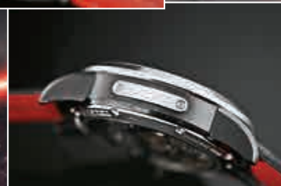
Star Wars Captain Phasma 陀飛輪腕錶規格