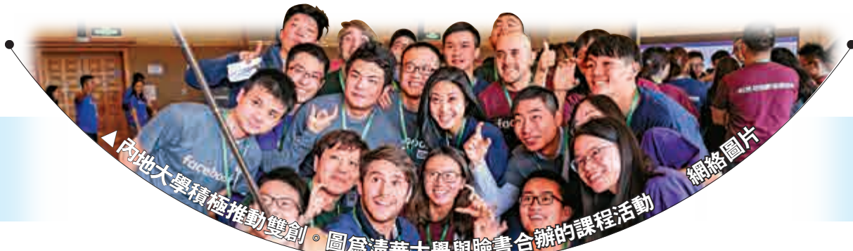
內地大學積極推動雙創。圖為清華大學與臉書合辦的課程活動