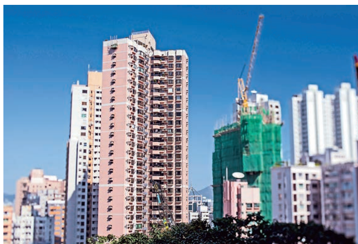
▲在港「上車」無期，青年為何不走入大灣區打拚創業呢？