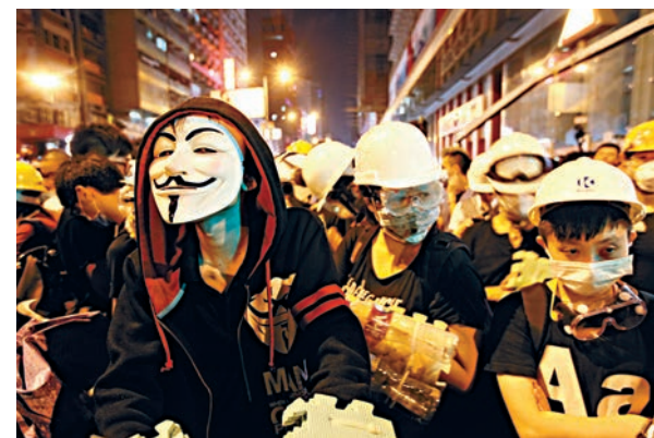
▲社會不容壞分子鼓吹分裂國家思想

鼓吹分裂國家思想在全世界都是零空間、零容忍的。戴耀廷言論不但嚴重違法，更影響香港長遠發展損害全港市民的利益，因此必須予以強烈譴責，依法懲處。