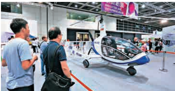
吸引環球人才來港，發展創科等高端行業，可為香港進一步提升競爭力

同時，筆者也希望政府走出這一步的同時，結合香港特點給予更吸引人才的配套政策。例如香港居住成本高，可能成為人才不願到香港發展的一大因素。政府可借鑒某些內地城市的人才政策，只要落戶，就馬上借出租樓啟動金，或者直接獎勵現金，買樓按面積給予補貼等等。多管齊下，定能留住稀缺人才，為香港進一步提升競爭力。