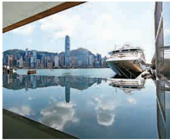
香港人應在國家發展中做好自己的角色，發揮重要作用

在新形勢、新發展的今天，港人跟上國家腳步，積極配合，打造出內地一個又一個科技獨角獸企業。