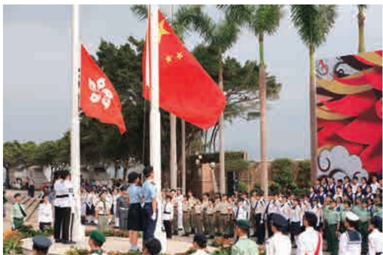
參加五四升旗禮的青少年，對國旗飄揚感自豪

青年是社會未來的棟樑，若未能從根本的教育做起，這個城市未來將會與國家的疏離感更大，難以有所大作為。