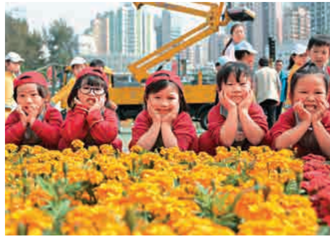
正確認識國家歷史，讓下一代好好建設未來

國家一直十分重視五四青年節。今年，國家主席習近平在北京大學師生座談時對青年提出四點希望：愛國、勵志、求真、力行，並指出青年是國家的希望、民族的未來，對青年寄予厚望。五四精神實在值得弘揚，筆者期望社會各界舉辦更多活動，讓青年人可以正確認識國家歷史，傳承愛國傳統，不要辜負國家主席習近平對我們這一代青年的期望。