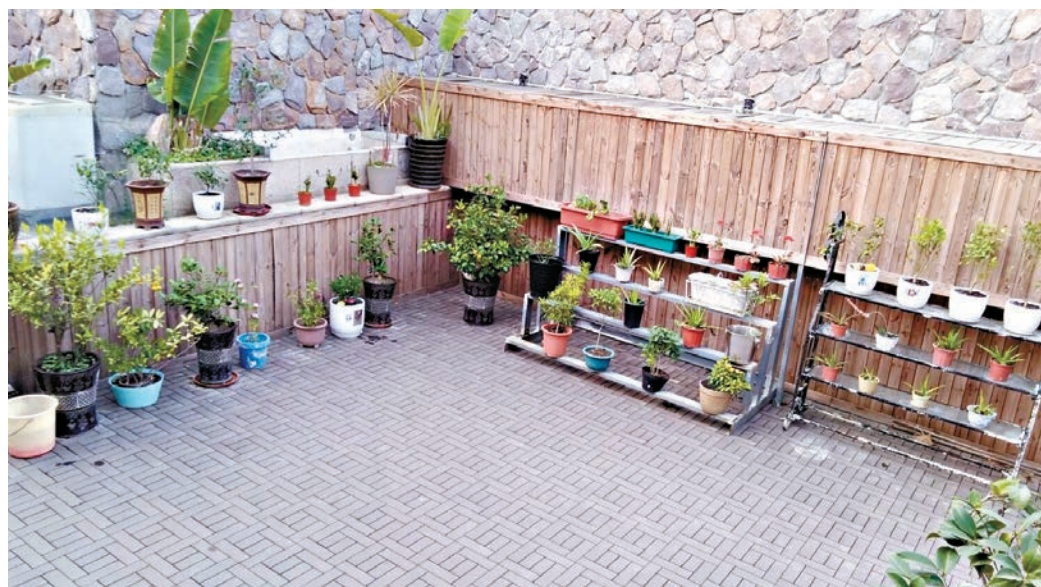
▲寵物遺體經水化壓縮變成骨灰，可混入泥土種植盆栽，開展另一段新生命