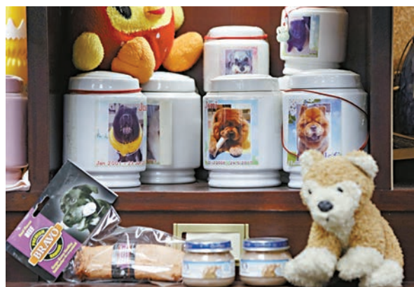
▲寵主租用寵物龕位供奉，時不時探訪祭拜