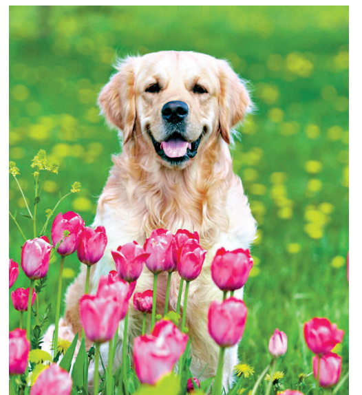
▲主人對寵物作出一生一世的承諾，也希望能讓毛孩「走得體面」

水化處理遺體，標榜較傳統土葬或火化手法環保。對比土葬分解需時三至五年，水化自然分解速度更快，過程間亦不產生甲烷氣體；相比火化更綠色處理遺體，不會造成空氣污染、沒有釋放溫室氣體、顆粒物、一氧化碳，等等。