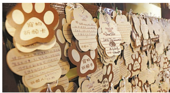
▲寵物殯儀公司牆上貼滿主人對逝去寵物的話語與思念