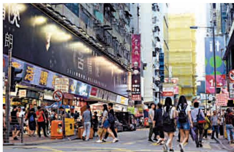
油尖旺區議會大比數通過撤銷旺角行人專用區的動議

就撤銷旺角行人專用區議題，有議員站在居住在該區居民利益上，以獲得較舒適宜居環境而支持，有長期在該區租置