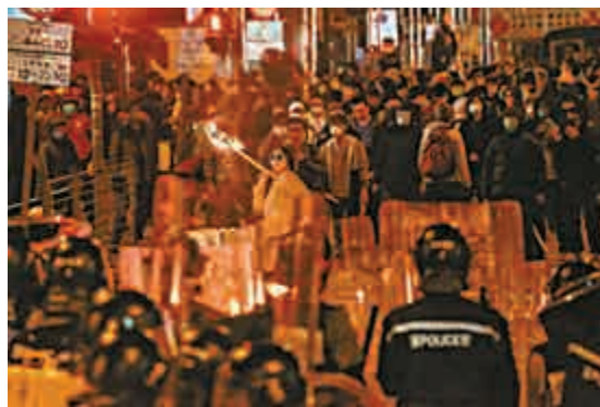
年輕人心智未成熟，被不法之人誤播錯誤觀念參與旺暴

正確的事，活出精彩充實人生。筆者希望年輕人能夠參照借鏡，不要再走違法暴力亂港的錯誤事情，「選擇做對的事，並把對的事情做對。」未來的你必定會感謝今天作出正確選擇的你。