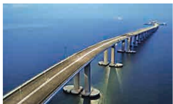
港珠澳大橋即將通車，勢必將香港的物流業帶上一個新水平

購，更加趨旺兩區物流用地，再加上港珠澳大橋即將通車，粵西方向的物流將更通暢及帶來大量客流、物流，勢必將香港的物流業帶上一個新水平。