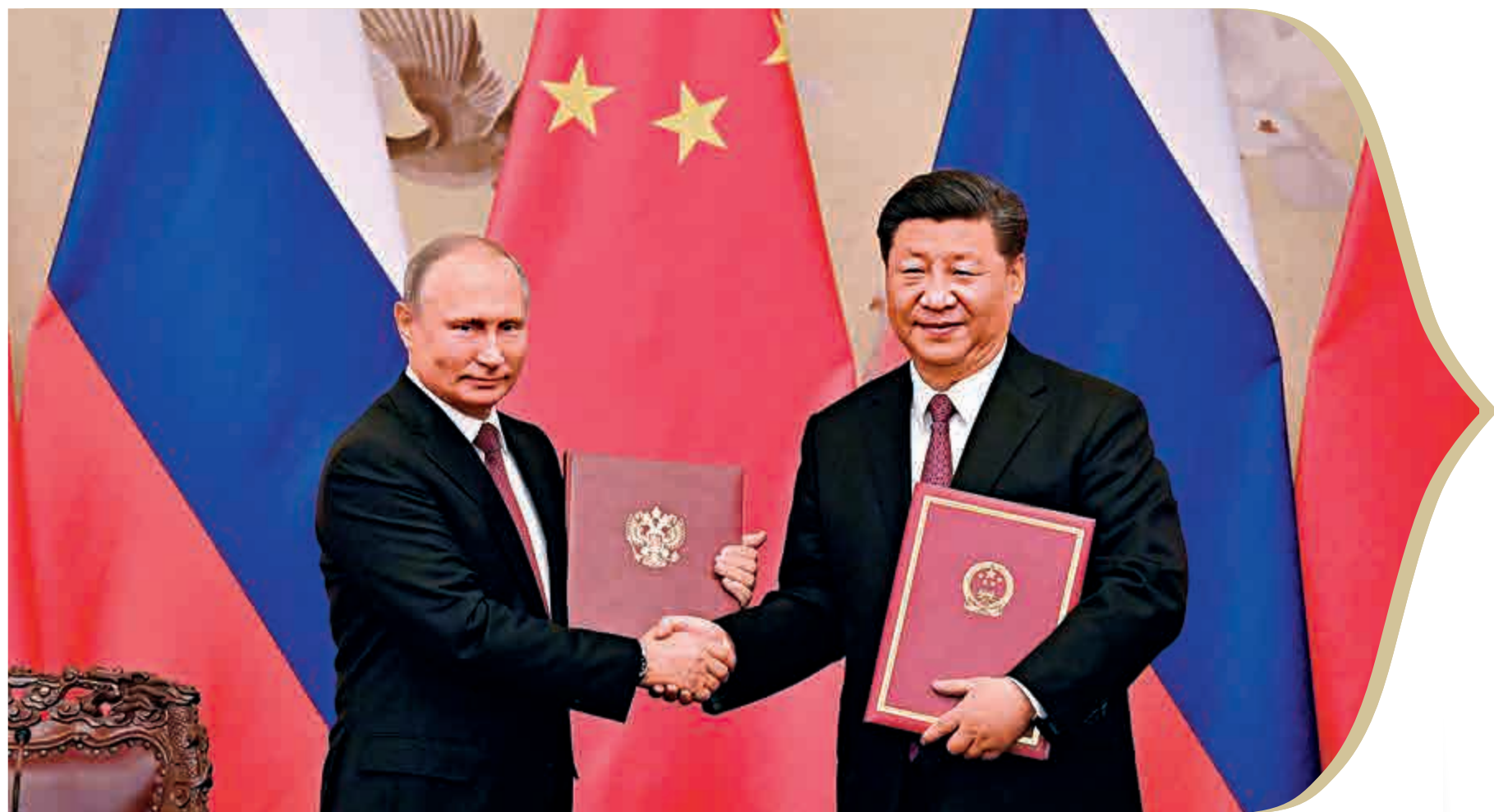
▲中國國家主席習近平同俄羅斯總統普京會談後簽署中俄聯合聲明