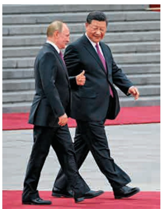
▲習近平在歡迎儀式上與普京交談