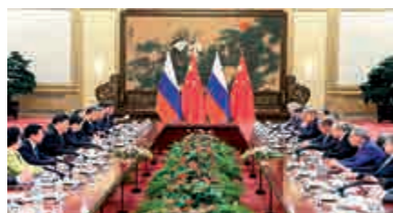
▲8日，國家主席習近平同俄羅斯總統普京舉行會談

普京會談期間談到在高技術領域與華進行合作的問題，涉及飛機製造、遠程幹線客機以及新型重型直升機