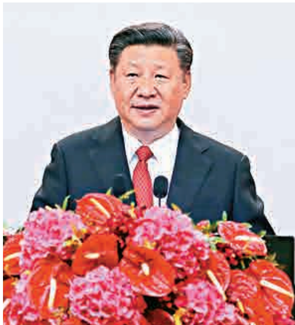
▲2017年6月30日，習近平出席香港特別行政區政府歡迎晚宴並發表重要講話