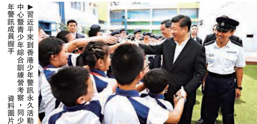
▲習近平來到香港少年警訊永久活動中心暨青少年綜合訓練營考察，同少年警訊成員握手 資料圖片

2月14日，習近平親自給香港「少年警訊」成員回信。有香港青年領袖感慨地說，這是總書記「情牽」港青少年，並為香港青少年工作帶來清晰的引領與啟示。