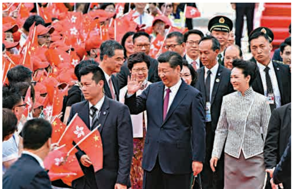
▲習近平視察香港時出席《興建香港故宮文化博物館合作協議》簽署儀式，並同現場演唱粵劇選段的兩名兒童親切交談 資料圖片 ▲2017年6月29日，中共中央總書記、國家主席、中央軍委主席習近平專機抵達香港。這是習近平和夫人彭麗媛在機場向歡迎的人群致意 資料圖片