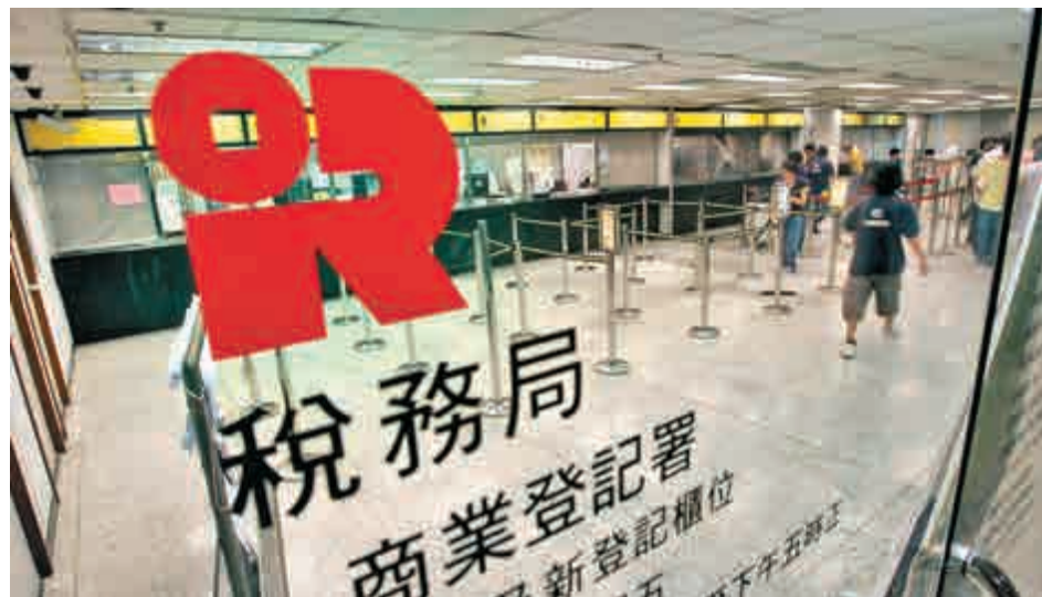
▲推行利得稅兩級制，政府庫房每年少收58億元