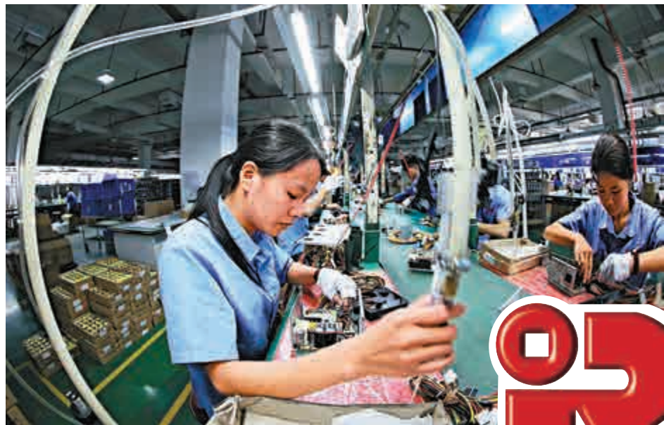
▲政府對中小企推行利得稅兩級制，大大減輕企業經營成本