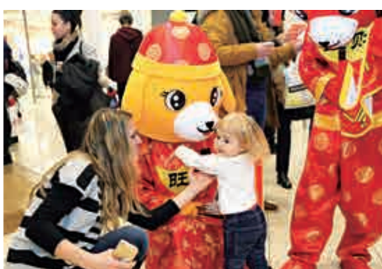
▲我國「一帶一路」建設，促進世界文化交流。圖爲保加利亞索非亞市民參與當地舉辦的中國文化活動

中國發展模式極具參考性，身爲香港青年人，我更加鼓勵年輕人，多了解國家國情、歷史發展，並在新的時代、新的機遇中找到自己的定位，從而尋找發展機會，千萬不能辜負了自己的青春年華。