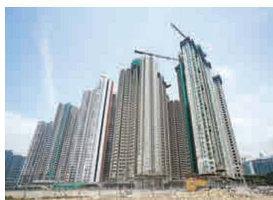
▲特首日前公布六項房屋政策新措施，期望藉修訂資助出售房屋的定價政策，重燃市民置業希望

，接下來的一年，除了發展外，筆者建議政府應好好深化基礎，如新成立的一些委員會，要有實際行動，另外有見一些委員會缺基層代表，欠缺廣泛性。當局應再廣泛邀請社會其他有經驗人士加入，令委員會發揮更大功效，令政策更具針對性及全面。