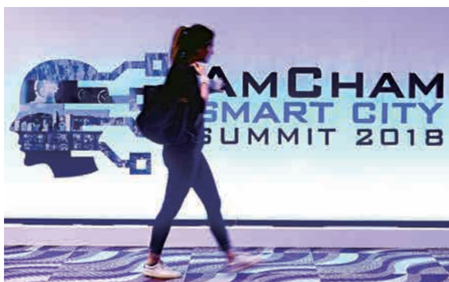
人工智能正改變環球社會大眾生活文化，在粵港大灣區發展中，屬不可或缺的技术

定的優勢，例如在與國際接軌方面。可是，香港若要發展成爲世界級智慧城市，筆者認爲市民需要有用數碼科技生活的習慣，才能相得益彰。