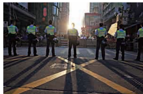
▲香港警察保障市民安全，令社會大眾安居樂業

速度快、信息集中、各種服務選項集於一身，這是以手機程式爲代表的現代生活的發展趨勢。慈善業作爲一項需要更多人關注的事業，更加需要與時俱進。香港慈善機構本身管理完善，涉獵範圍很廣，有這樣的基礎，再加上政府的支持，能走在前列就不足爲奇了。FOOD-CO此次作出了表率，也希望可以引領其他的慈善機構，在政府的支持下，在安老服務，善款發放，醫療援助等等方面都能做到升級，讓捐助者與被捐助者都能有更好的體驗。