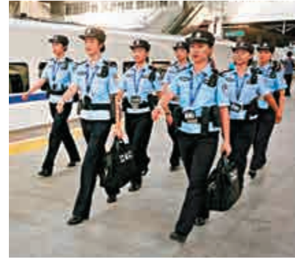
▲「福港高鐵路女子乘警隊」整裝待發

的美好寓意。這6名乘警平均年齡24歲，綜合能力突出，肩負着維護高鐵路列車秩序穩定、保障安全、打擊犯罪之重任。另據介紹，值乘前，福州鐵路公安處專門組織人員對女子乘警隊開展了為期30天的業務和綜合素質培訓，及警務禮儀、香港習俗、英語、粵語等內容的學習。