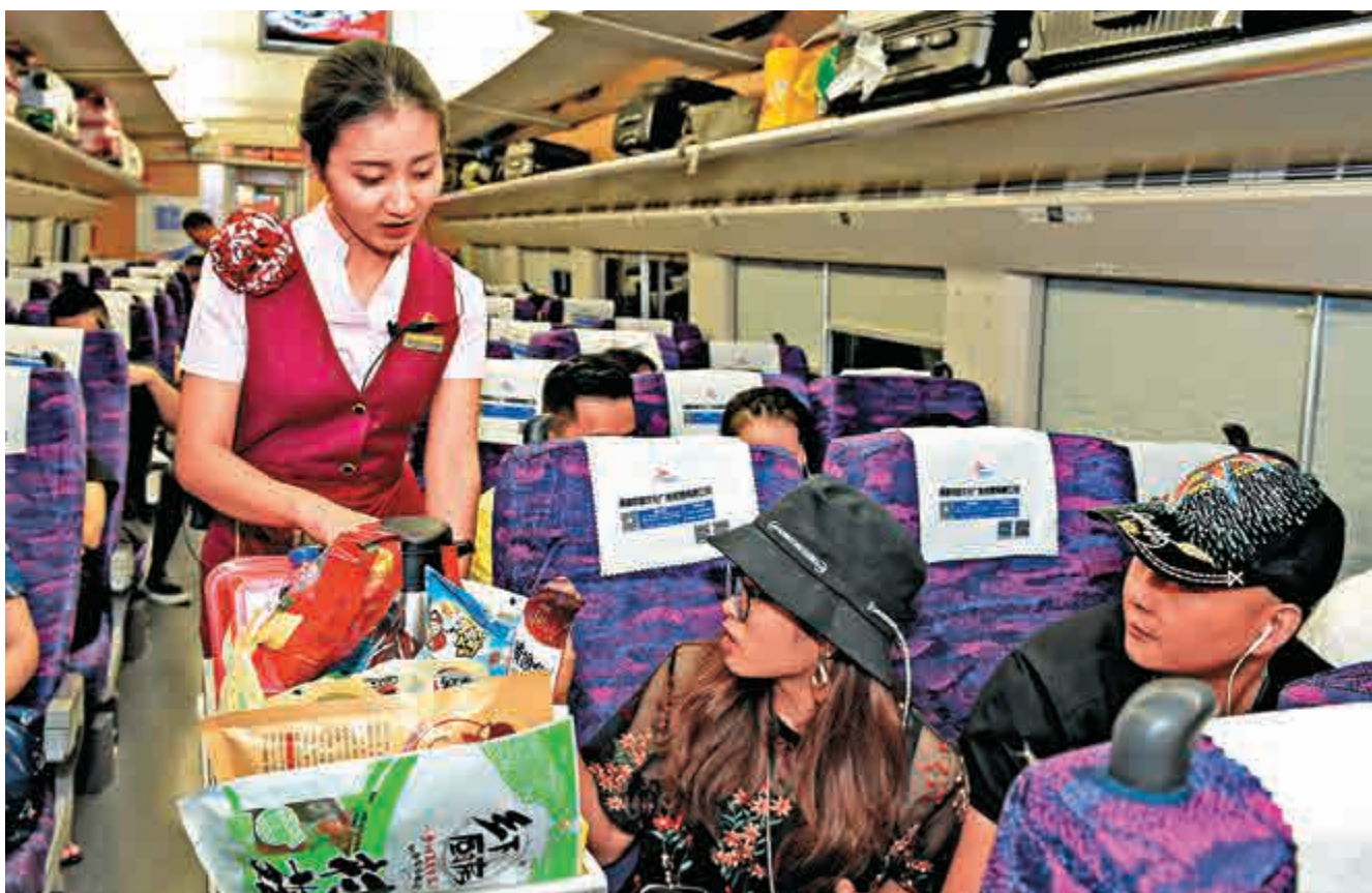
▲廣深港高鐵的貫通見證了中國鐵路驚人的發展速度。圖為乘務員在由福州始發開往香港的G501次列車上為乘客服務。新華社