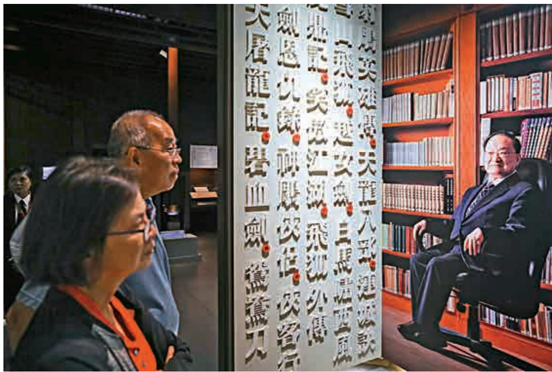
▲不少市民昨日往金庸館參觀，緬懷這位文學泰斗

由查良鏞（金庸）先生生前創辦的明河社出版有限公司昨晚代表查先生家人發布訃告：根據查先生生前意願，喪禮以私人形式舉行。茲定於11月12日至30日在香港文化博物館的「金庸館」設置弔唁冊，以供公眾向查先生作最後致意。訃告說，查良鏞先生於2018年10月30日下午在家人陪伴之下，於香港養和醫院安詳逝世，享年94歲。明河社謹代表查先生家人感謝社會各界人士的關懷。