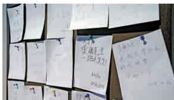
▲金庸館內留言板寫滿讀者緬懷金庸先生的留言