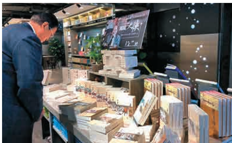
▲讀者正在山東書城觀看金庸先生作品

此外，來自京東平台的數據顯示，10月30日傍晚傳來金庸先生去世消息後，晚19點起，該平台「金庸」相關搜索量環比暴漲超過60倍，於21點達到搜索頂峰。其中，書迷們搜索最多的作品是《天龍八部》，其次是《笑傲江湖》、《神鵰俠侶》和《射鵰英雄傳》。當晚20點時，金庸先生作品銷量環比增長超過120倍。