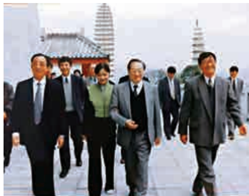
▲1998年金庸參觀大理三塔

1999年，金庸再次來到雲南參加黃杯圍棋賽，當時，記者在新聞發布會上向金庸提問的問題，其內容也與他作品中常有圍棋情節有關。的確，金庸作品裏，武林高手中也有很多圍棋高手。其中，最著名的一段便是《天龍八部》中虛竹誤打誤撞破解無崖子擺出的珍珑棋局，成為金庸小說中的經典篇章。