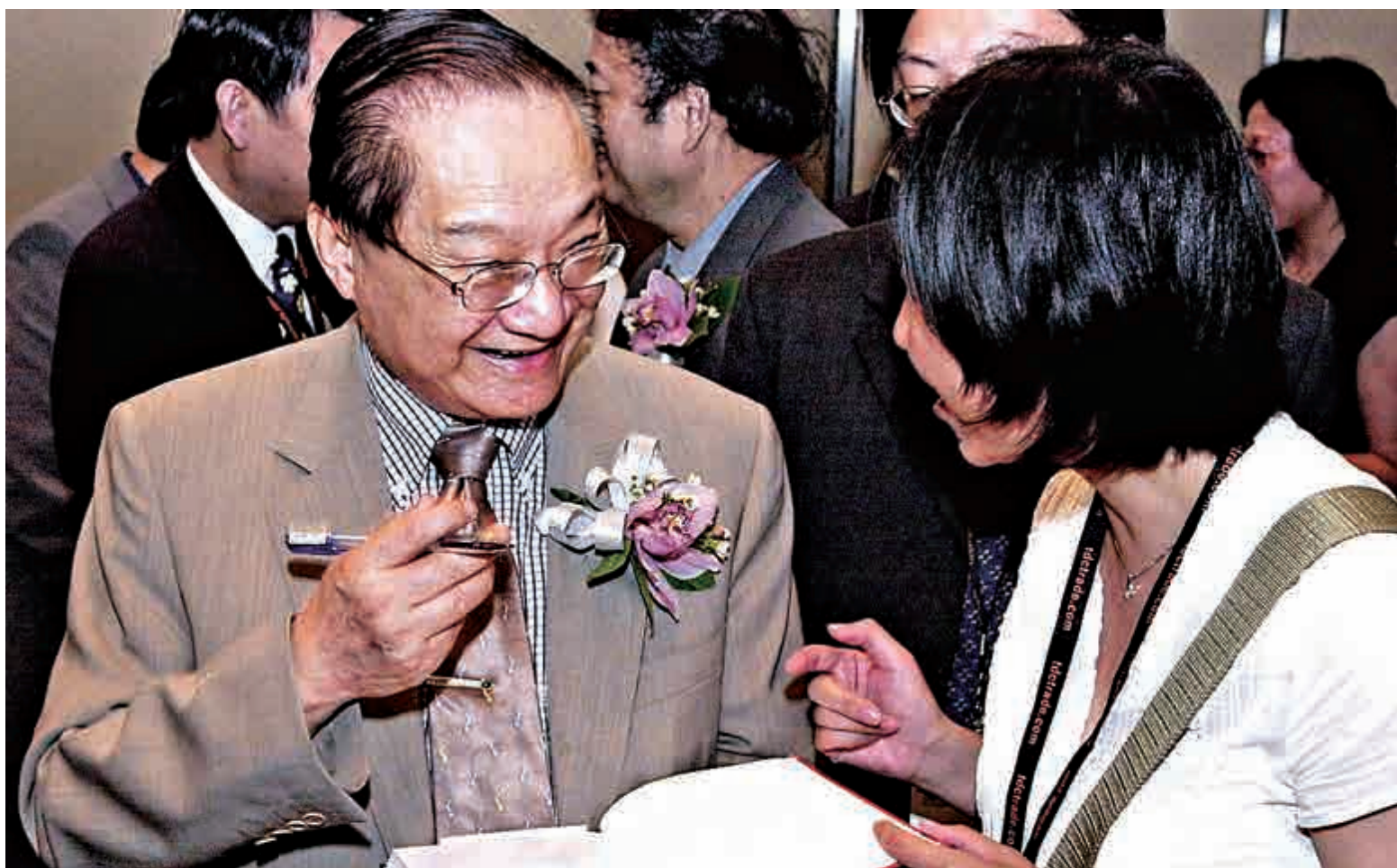
▲這是2001年7月22日，金庸（左）在2001香港書展上為讀者簽名留念

30日晚金庸逝世的消息在朋友圈刷屏，金庸生前好友、阿里巴巴董事局主席馬雲31日在非洲通過官方微博發文悼念金庸，直指若無先生，不知是否還會有阿里。「微信之父」、騰訊集團高級執行副總裁兼微信事業群總裁張小龍也在31日凌晨在自己的朋友圈中追思，曾經開發的foxmail郵箱的取名，正是受到《笑傲江湖》的啟發。「取令狐冲之「狐」，叫foxmail。以此紀念金庸。」