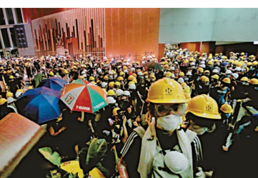
▲大批戴口罩、頭盔的暴徒闖入立法會大樓