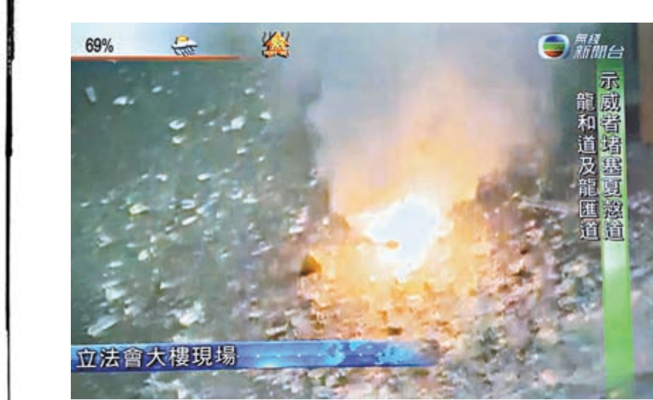
▲有暴徒向大樓內投擲燃燒物