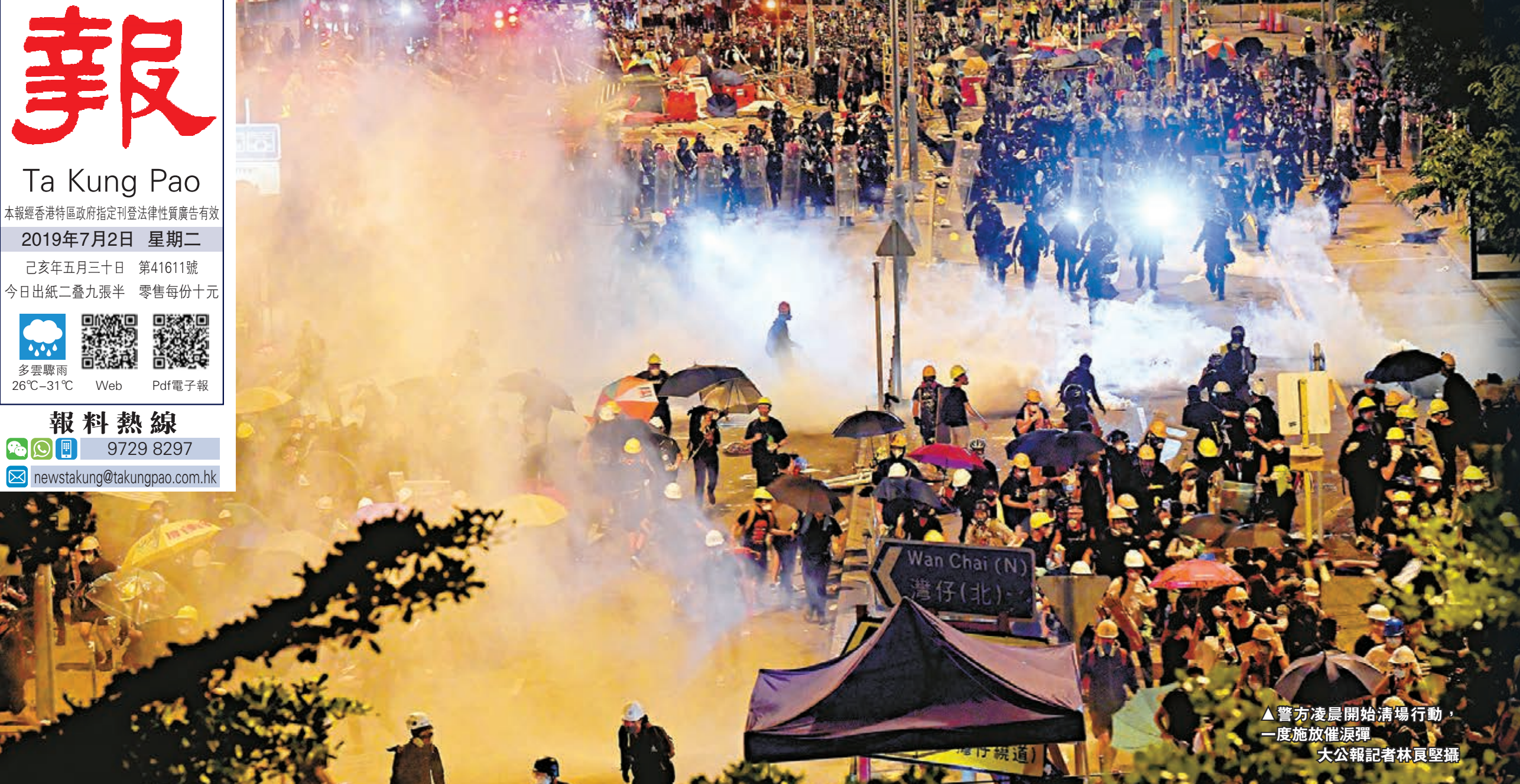
▲警方凌晨開始清場行動，一度施放催淚彈