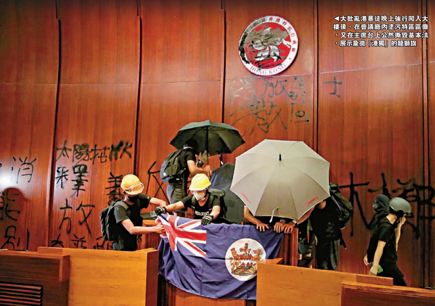
▲大批亂港暴徒晚上強行闖入大樓後，在會議廳內塗污特區區徽，又在主席台上公然撕毀基本法，展示象徵「港獨」的龍獅旗

大批亂港暴徒昨早企圖擾亂慶祝香港回歸祖國22周年升旗儀式，幸得警方嚴正執法阻止。但暴徒下午轉而衝擊立法會大樓，晚上強行闖入大樓後，在會議廳內塗污特區區徽，又在主席台上公然撕毀基本法，展示象徵「港獨」的龍獅旗，更煽動成立「臨時政府」。政府、立法會和警方都強烈譴責暴力。警方凌晨開始清場行動，政界中人直斥事件是「顏色革命」，支持警方以強力手段平暴，恢復憲制秩序及社會治安。