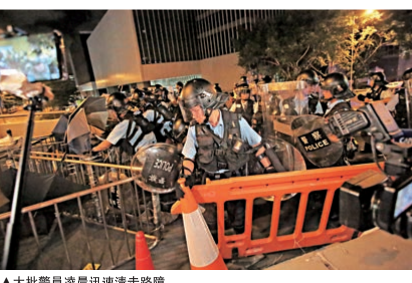
▲大批警員凌晨迅速清走路障