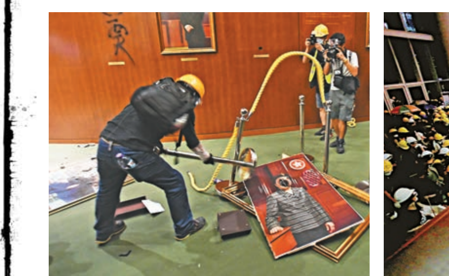
▲多幅立法會主席畫像被塗黑及打爛