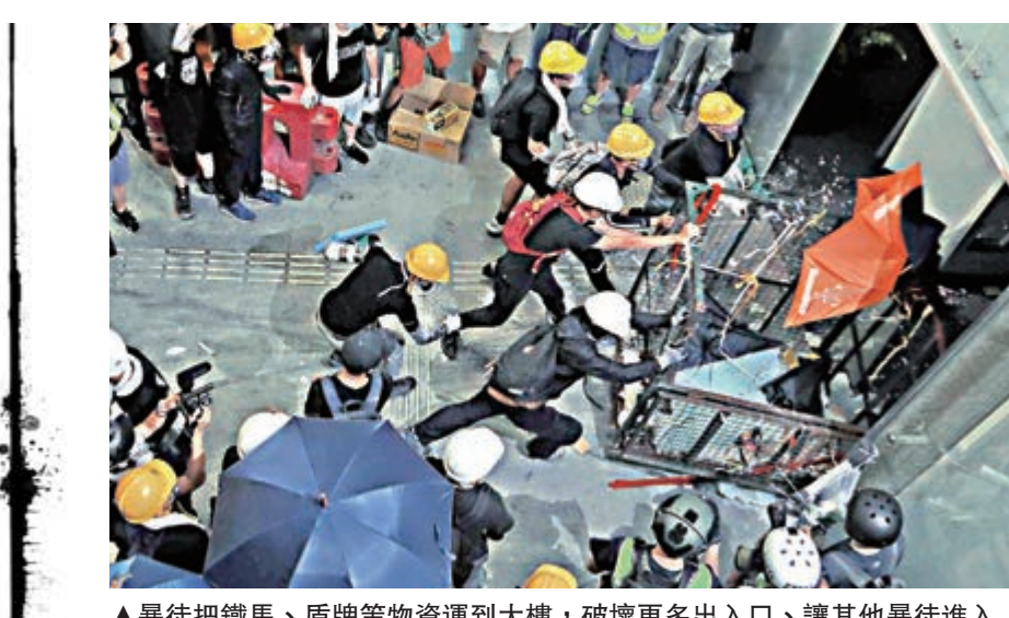
▲暴徒把鐵馬、盾牌等物運到大樓，破壞更多出入口，讓其他暴徒進入