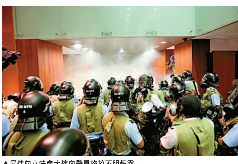
▲暴徒向立法會大樓內警員施放不明煙霧