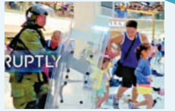
▲有目擊者拍片還原真相，證明警察是護送父女離開