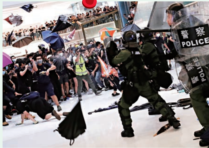
▲保安局表示，關於公眾遊行及集會，政府會繼續沿用現行機制來處理，除此之外，沒有其他計劃。圖為較早前警方在新城市廣場執法時遭暴徒圍攻

除地契條款外，根據第232章《警隊條例》第50條，如警務人員有理由相信任何須予逮捕的人已進入或置身在某處，居住在某處或管理該處的人須容許警務人員自由進入該處，並給予合理便利，當中更列明「免使須予逮捕的人有機會逃避警務人員而未取得該手令的情況下」，入內搜查乃屬合法。換言之，警方按執法需要可以在無手令下進入私人地方。