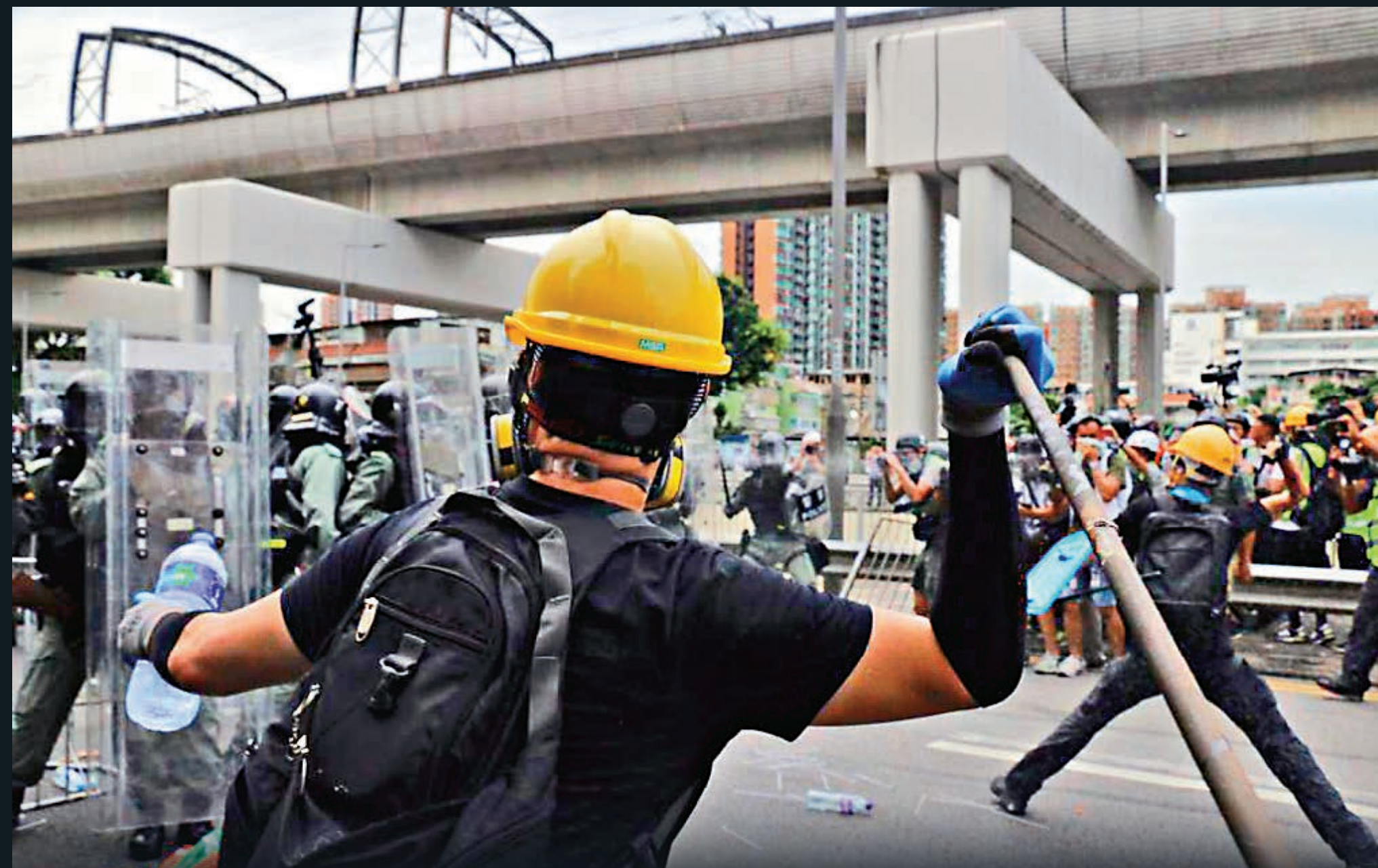
▲暴徒揮動長棍猛打示威者