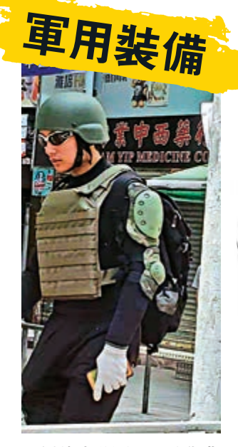
▲暴徒穿著軍用「戰術背心」