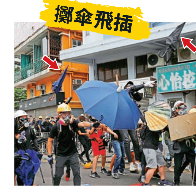
▲暴徒以傘作矛擲向警員(箭頭示)