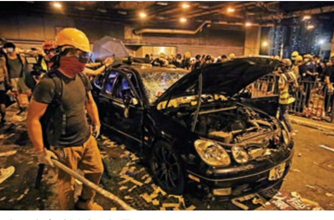
▲有私家車被暴徒「拆骨」