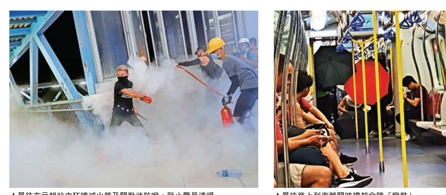
▲暴徒在元朗站內狂噴滅火筒及開動消防喉，阻止警員清場