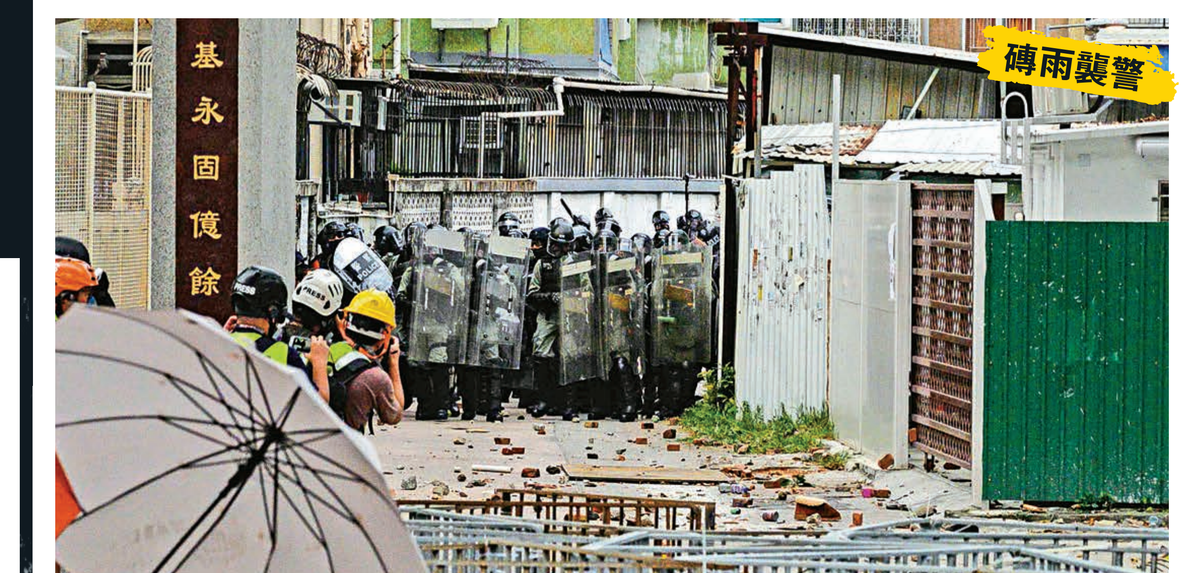
▲警方在西邊圍其中一個村口築起防線，暴徒不斷投擲磚頭施襲，警方多次後退

下午約4時半，暴徒行動升級，先在西邊圍村口對出的朗業街折走路邊欄杆製成一條條長鐵枝，亦有部分被製成用於衝擊警方防線的三角鐵陣，另有黑衣服者登上大廈天台觀察，頻按手機，相信是發號施令。地面的暴徒配備頭盔、眼罩、木製盾牌、雨衣、登山杖等裝備後，從朗業街向西邊圍村口進逼，警方在人數劣勢下一度後退，暴徒不斷叫囂及用硬物攻擊路邊欄杆，持續發出巨大響聲，製造聲勢及恐怖氣氛。 狂投摺棍磚塊擊碎警盾 部分暴徒後持頭轉往朗業街另一側，即與該街並排的安樂路，包圍一架途經的警車，以侮辱字句塗污車身，攔車車窗，又用雜物阻礙車胎，令該警車無法前行。暴徒大聲叫喊，揚言要警察下車。轉移陣地的過程中，暴徒分工細緻、組織化程度高，有人裝備齊全始終走在前線、有人專門拿物資分發、有人負責聯絡及協調行動方向等。 眼見有警員面臨威脅，現場外圍另一批防暴警察沿安樂路向被困警車推進，並呼籲市民離開。在暴徒不願散去且開始投擲雜物的情況下，警方舉起黑旗警告，無效之下放催淚彈驅散，有暴徒拾起