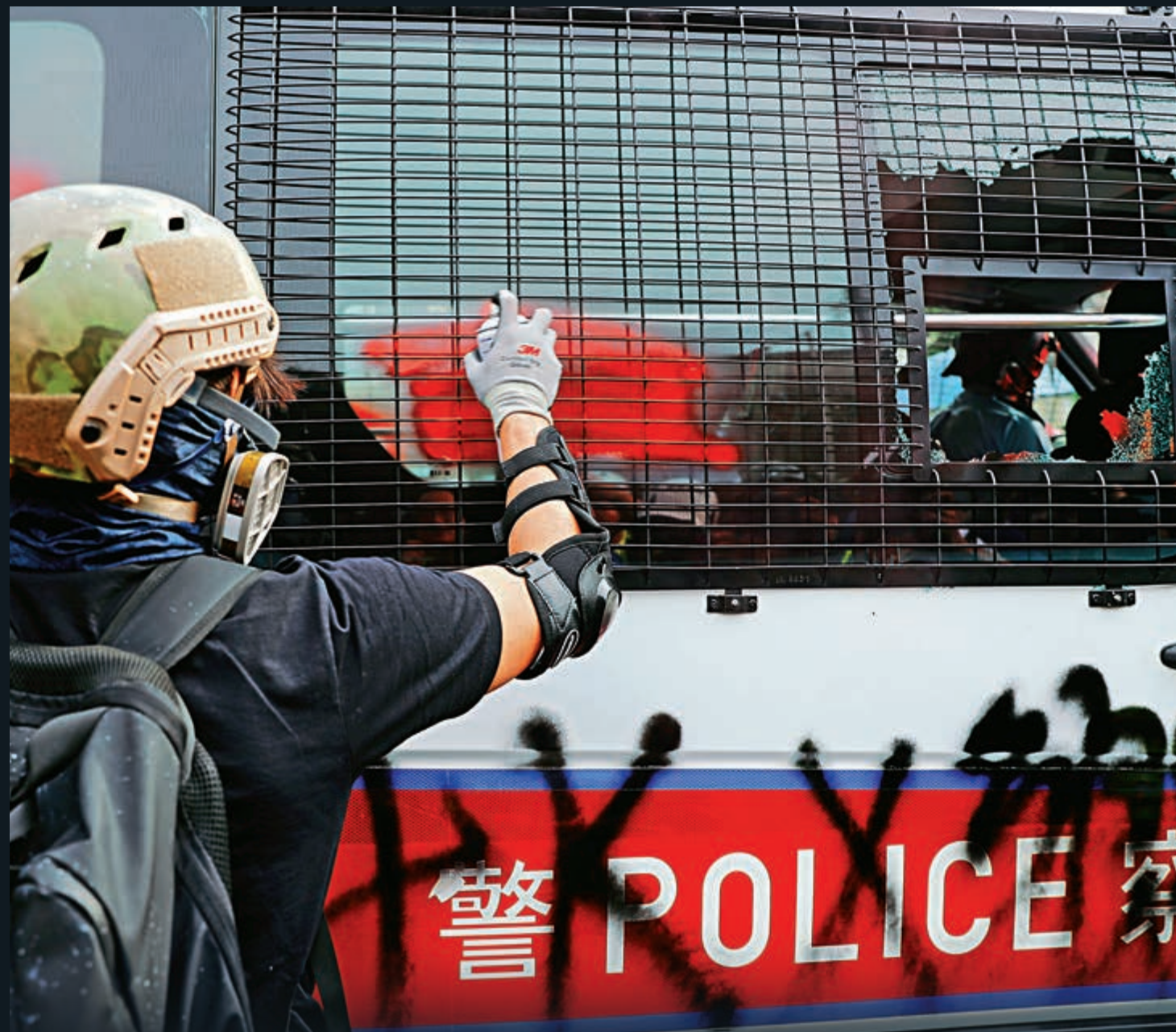
▲暴徒扑擊警車車窗，又向車身噴寫辱警字句