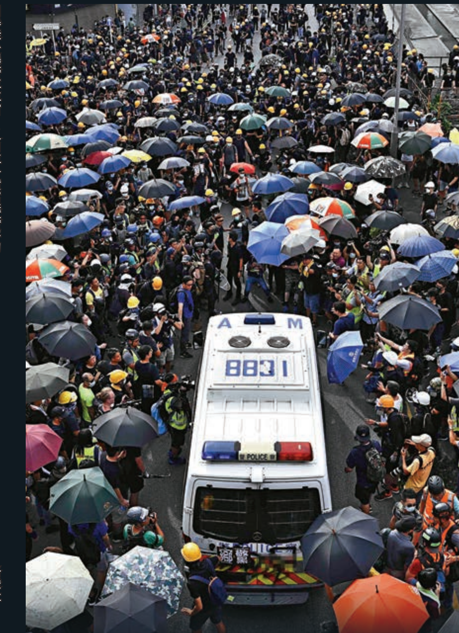
▲警車被暴徒重重包围