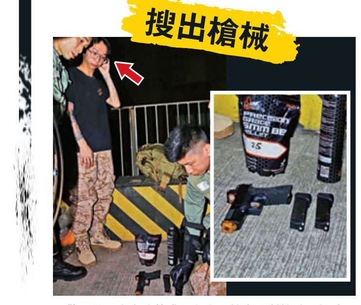
▲警員從黑衣人(箭頭示)身上搜出仿製槍械、銅珠、BB彈以及伸縮警棍等