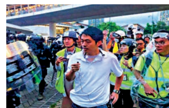
▶許智峯現身東涌站，阻撓警方執法