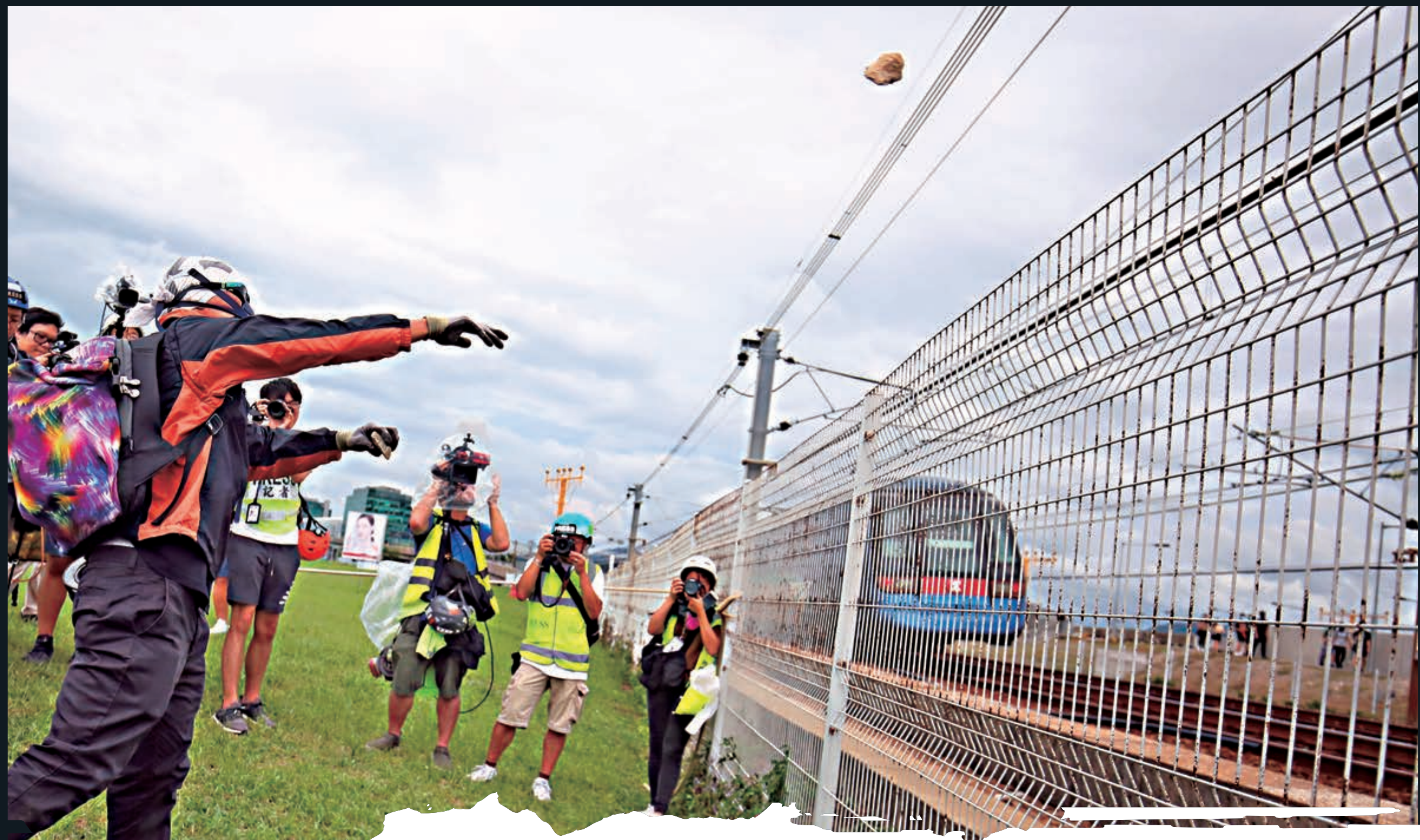
▶暴徒向鐵路軌投擲雜物，列車被迫半路停駛，車頭被破壞

繼上月「佔領」機場後，大批亂港暴徒昨日下午強闖受法庭臨時禁制令保障運作的機場客運大樓，涉嫌觸犯暴動、非法集結、藐視法庭等多宗罪行。離開客運大樓後，暴徒於機場一帶非法集結，大肆堵路、縱火，並破壞港鐵東涌站，闖入控制室大肆搗亂，有市民被指拍攝，遭暴徒打斷手臂。由於多條港鐵線及巴士線受阻，攜帶行李的旅客被迫下車，在酷熱天氣下步行數小時趕往機場，有旅客累垮倒地受傷。有暴徒拆下東涌泳池的國旗焚燒，途經鐵道軌又向圍欄內投擲雜物，致使列車半路停駛，列車車頭被磚頭砸壞。特區政府嚴厲譴責破壞及違法行為，強調警方會果斷執法，保障廣大市民的安全及權利。