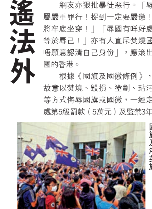
▶大批「惡棍」搗事辱國，外搗舞者英日在英國領事館外搗舞者英日

【大公報訊】記者與學聯報道：約十多名暴徒昨日下午到東涌游泳池，公然拆下國旗焚燒。七月底至今，已經接連發生至少六起污損國旗、國徽的事件，政界人士強烈譴責有關行為損害國家尊嚴，觸碰「一國兩制」底線，傷害全國人民感情。他們呼籲警方嚴正執法，絕不能讓暴徒逍遙法外。 幾名暴徒昨日下午進入東涌游泳池，一名金髮、戴黑色口罩的暴徒攀上旗杆拆下國旗，約十名黑衣人攔截拿掩護。他們先將國旗放入垃圾桶，之後再將國旗放在行人路燒毀。 「好憤怒！國旗是國家的象徵，燒國旗即是不尊重香港，不尊重國家。」港區全國人大代表盧瑞安希望警方能夠嚴正執法，緝拿狂徒。 工聯會立法會議員何啟明批評，暴徒刻意侮辱國旗，其心可誅，他們侮辱國家象徵，侮辱國人尊嚴。市民要看清楚這樣的行為，一定要割席，絕不能縱容這樣的行為。 網友亦狠批暴徒惡行。「辱國行為屬嚴重罪行！捉到一定要嚴懲！最好係將牢底坐穿！」「辱國有咩好處，辱國等於辱己！」亦有入直斥焚燒國旗者「唔願意認清自己身份」，應滾出屬於中國的香港。 根據《國旗及國徽條例》，公開及故意以焚燒、毀損、塗劃、玷污、踐踏等方式侮辱國旗或國徽，一經定罪，可處第5級罰款（5萬元）及監禁3年。