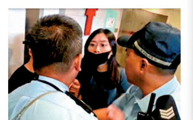
▶「口罩女」被查問時「老屈」警察「蝦女仔」

【大公報訊】突發組報道：搗事分子無視禁制令在機場搗亂，被追捕時「反咬」警員。有大批搗事者昨日越過機場快線站圍欄進入機場，警方在客運大樓內進行驅散。有蒙面暴徒為躲避警方追捕，逃至廁所內反鎖廁格。有男警到廁所拍打廁格，搜捕暴徒。 昨日中午，女保安發現在女廁內躲藏了三名未能出示登機證的「口罩女」，隨即通知警方。三名少女步出廁所時，有少女支支吾吾聲稱：「入機機場係為咗搵返唔見咗電話。」惟當有男警質問少女是否有登機證及何時遺失電話時，該少女開始扮屈，拒絕回答問題，其身旁另一口罩女就厲聲高呼：「嘩，警察好惡，講嘢好大聲，蝦女仔呀！」