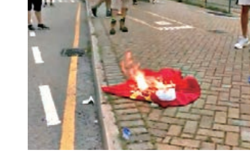
▶有暴徒拆下東涌泳池的國旗焚燒