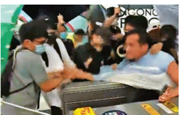
▶有市民被指拍攝，遭暴徒猛打手臂至骨折