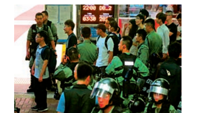
▶警方昨晚在中環碼頭截查坐船由梅高、愉景灣到市區的可疑人士