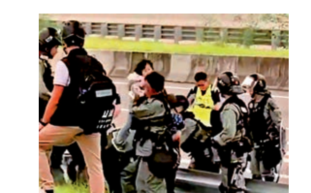
▶防暴警察協助四口之家繼續前行

【大公報訊】突發組報道：亂港暴徒昨惡意堵塞機場交通，旅客被迫拖着行李徒步數小時，由東涌走至機場客運大樓，當中一幕警員協助一家四口小家庭穿越圍欄的情景，令人動容。 網上片段可見，有一家四口在香港國際機場外一條行車路，緩步前往機場一號客運大樓。由於父親需要推着嬰兒車拖着行李，母親抱着幼子拖着女兒，未能越過圍欄走上車坪繼續前行。多名在機場戒備的防暴警員見狀，馬上前往協助。有女警把女童抱起，有警員協助該父親將嬰兒車及行李搬上車坪。事後，該個家庭更連連感謝警員的暖心協助。