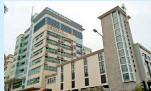
▲九龍塘宣道小學有老師讓小五學生做一份有「港獨」題目的工作紙