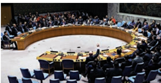
▲安理會15個理事國均

隨著綜合國力的不斷提升，中國對國際和地區事務參與程度更高。聯合國安理會曾就敘利亞問題決議草案進行過多次表決，中方則堅持通過和平、對話和政治方式解決問題，並七次動用否決權反對干涉。