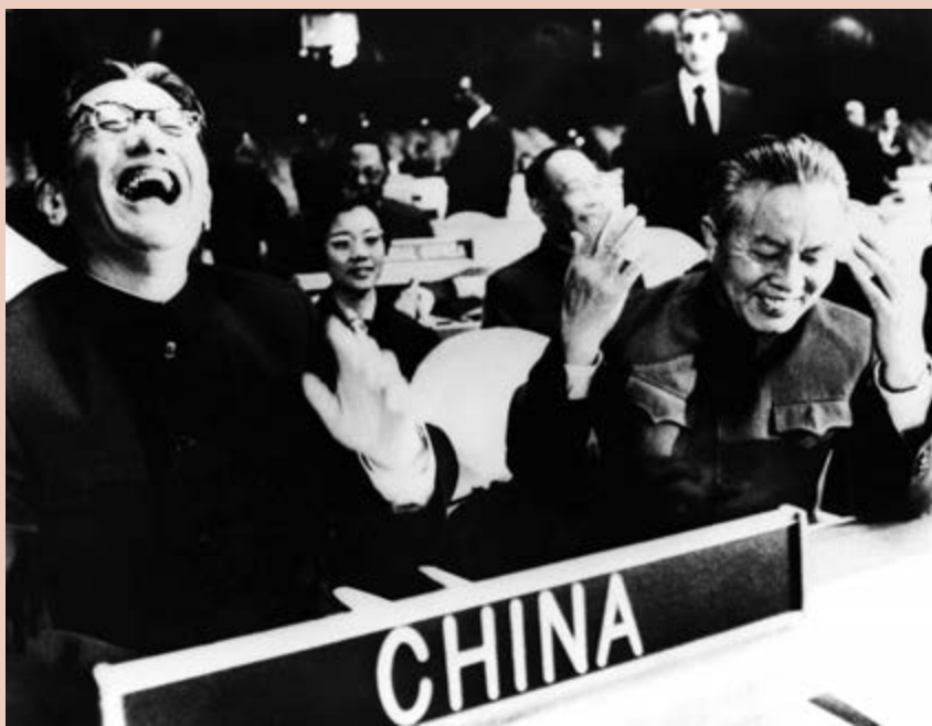
▲1971年10月25日，中華人民共和國正式恢復在聯合國的一切合法權利 資料圖片

時任敘利亞總統特使夏班於2015年表示，敘國內狀況比西方媒體報道好得多，感謝中國在聯合國安理會動用否決權，使敘利亞避免進一步陷入災難的深淵。