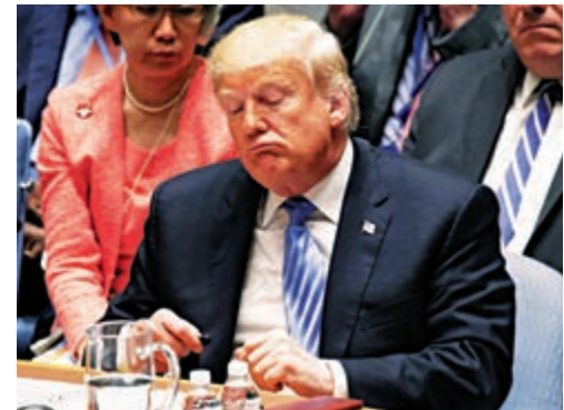
▲2018年9月26日，美國總統特朗普出席聯合國安理會會議

正因為否決權如此重要，所以安理會改革的焦點之一集中在擁有否決權的常任理事國身上。儘管改革已談了二十多年，但進展不大。個中的因素非常複雜，主要是五大國都不希望既得利益受損害，不願意看到既有否決權被削弱。但改革否決權的討論一直沒有停止過。有的主張廢除否決權，有的主張限制否決權，各方莫衷一是。但有一點可以肯定，如何使用否決權無疑是更高的一門外交藝術。