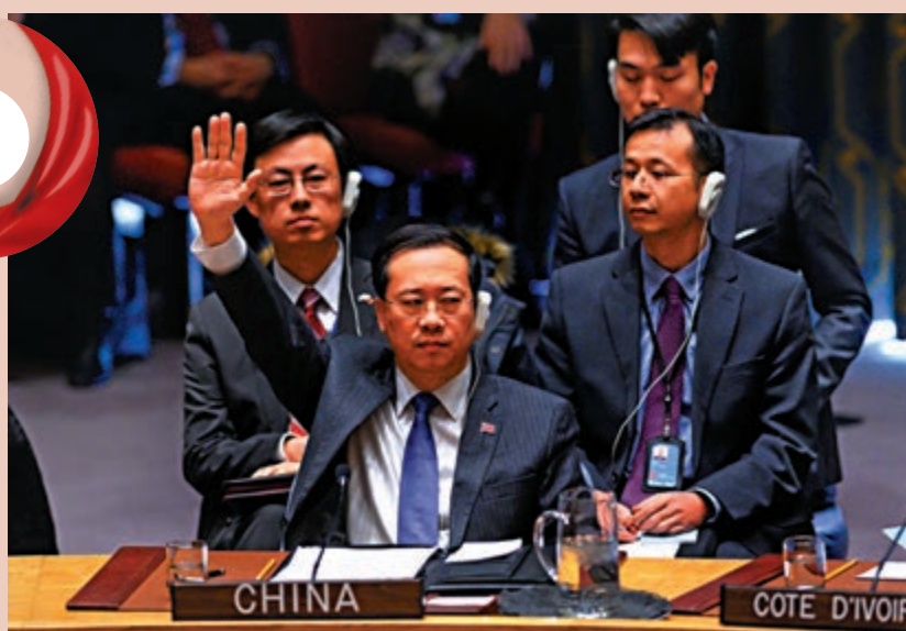
▲2019年1月26日，中國時任常駐聯合國代表馬朝旭對有關委內瑞拉問題的決議草案表決