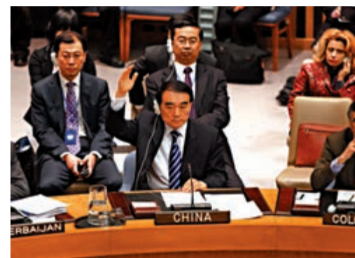
▲2012年2月4日，中國時任常駐聯合國代表李保東對有關敘利亞問題的決議草案投下反對票

聯合國是反法西斯戰爭勝利的產物。美、蘇、英等國領袖在戰爭還在進行時，就已經勾畫出戰後世界的藍圖。他們達成共識：大國必須對世界的和平與安全擔負起主要責任，必須讓它們在安理會享有一票否決權，從而促進「大國一致」，防止「大國不一致給世界帶來最危險的後果」。