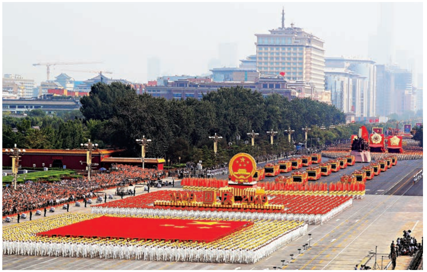
▲10月1日上午，慶祝中華人民共和國成立70周年大會在北京天安門廣場隆重舉行。這是群眾巡遊

【大公報訊】據新華社報道：初心鑄就偉業，使命引領征程。中共中央總書記、國家主席、中央軍委主席習近平1日在慶祝中華人民共和國成立70周年大會上的重要講話，在省區市各級黨委政府黨政幹部中引起熱烈反響。大家表示，總書記的重要講話是全國人民不懈奮鬥的信念和力量。在實現「兩個一百年」奮鬥目標的征途上，一定要不忘初心，牢記使命，更加緊密地團結在以習近平為核心的黨中央周圍，為實現中華民族偉大復興的中國夢努力奮鬥。