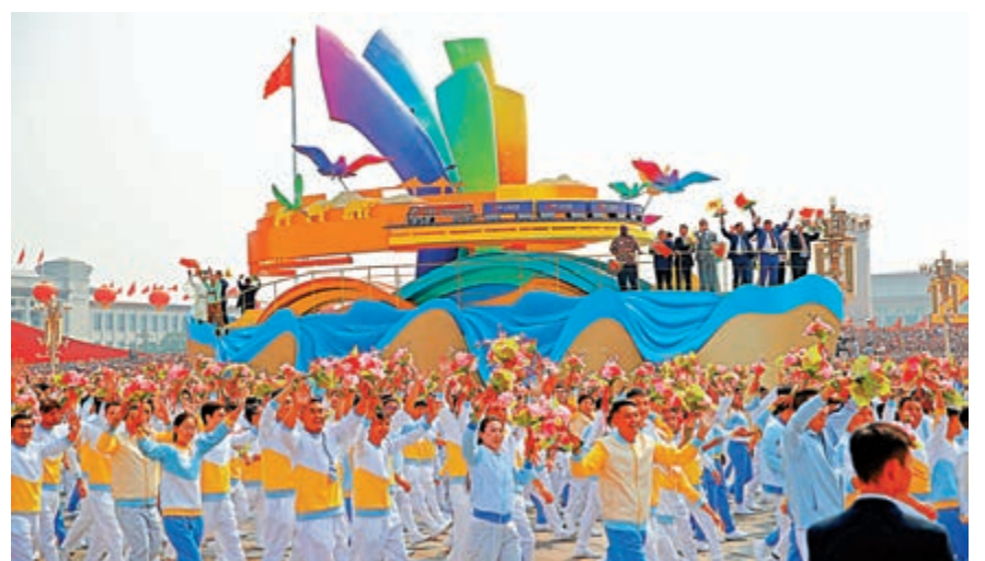
▲慶祝新中國成立70周年群眾巡遊中的「人類命運共同體」方隊 新華社