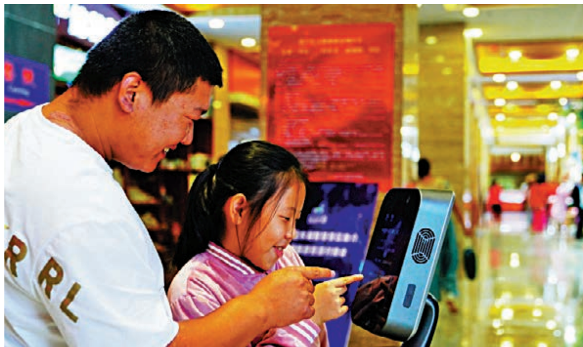
▲遊客在景區遊客服務中心和智能機器人工交流