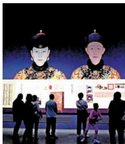
▲國慶假期，遊客參觀由故宮博物院和成都博物館聯合舉辦的「走進重華宮」特展

此外，能夠在境外景區獲得中文講解，是提升中國出境遊客幸福感的重要手段。「全球各地語音導覽統一提供中文語音服務，着力解決中國遊客無法深入了解景點的痛點，極大降低遊客了解景點的成本，同時也改善了遊客的旅行體驗。」語音導覽數據顯示，截至目前，使用該服務排名前三的分別是巴黎羅浮宮博物館、曼谷大皇宮和新加坡濱海灣花園。（記者 俞晝）