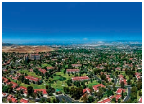
▲美國南加州橘郡「樂谷納森林之村」 資料圖片

樂谷納村原名「休閒世界」，可見其主力在激發年長者的活動力，以休閒活動活躍老齡人生。社區內的休閒設施齊備完善，應有盡有，包括七個大型俱樂部中心、五座溫水游泳池、兩座健身房、兩座高爾夫球場，也有橋牌室、網球場、羽球場、滾球場、桌球室、麻將室等，還有禮堂、演講廳、會議廳。社區內兩百五十多個社團定期在各種教室、交誼廳舉辦各種活動，教人目不暇給。社區提供的才藝技能