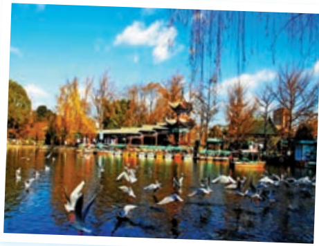
▲昆明翠湖公園 資料圖片

走過也是唐繼堯下令修築的定西橋，右轉到一處「江南園林」。上世紀三十年代龍雲任雲南省主席時，下令拆除原有的蓮華禪院，改建成「四合院」式的園林建築。大門坐西向東，院中間的大殿改成「戲台」，今天叫「觀魚樓」。九曲石橋通往湖心亭「碧漪亭」，亭閣飛檐黃瓦。前後兩個內院常用來舉辦各種展覽。碧漪亭南北角各建了一個重檐八角亭，以廊橋連接在一起，有點像無錫蠡園四季亭的構想。這裏條石鋪地，青苔叢生，能聞到撲鼻的桂花香氣。與凌寒獨開的蠟梅的冷香不同，桂花香甜甜的，帶著世俗生活的煙火氣，可喜可親。水面上荷葉田田。前不久曾抽乾翠湖湖底淤泥，所以荷花打苞的多，開花的少，不過依然風致楚楚，足堪遊賞。